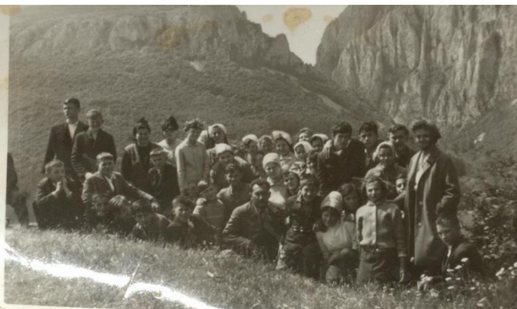
Grup din Hodod în excursie la Cheile Turzii (1967)