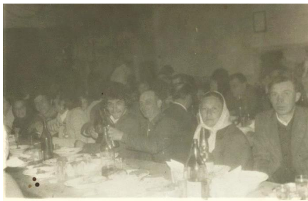
Nunțile se organizau la castel în camera rotundă (1980)