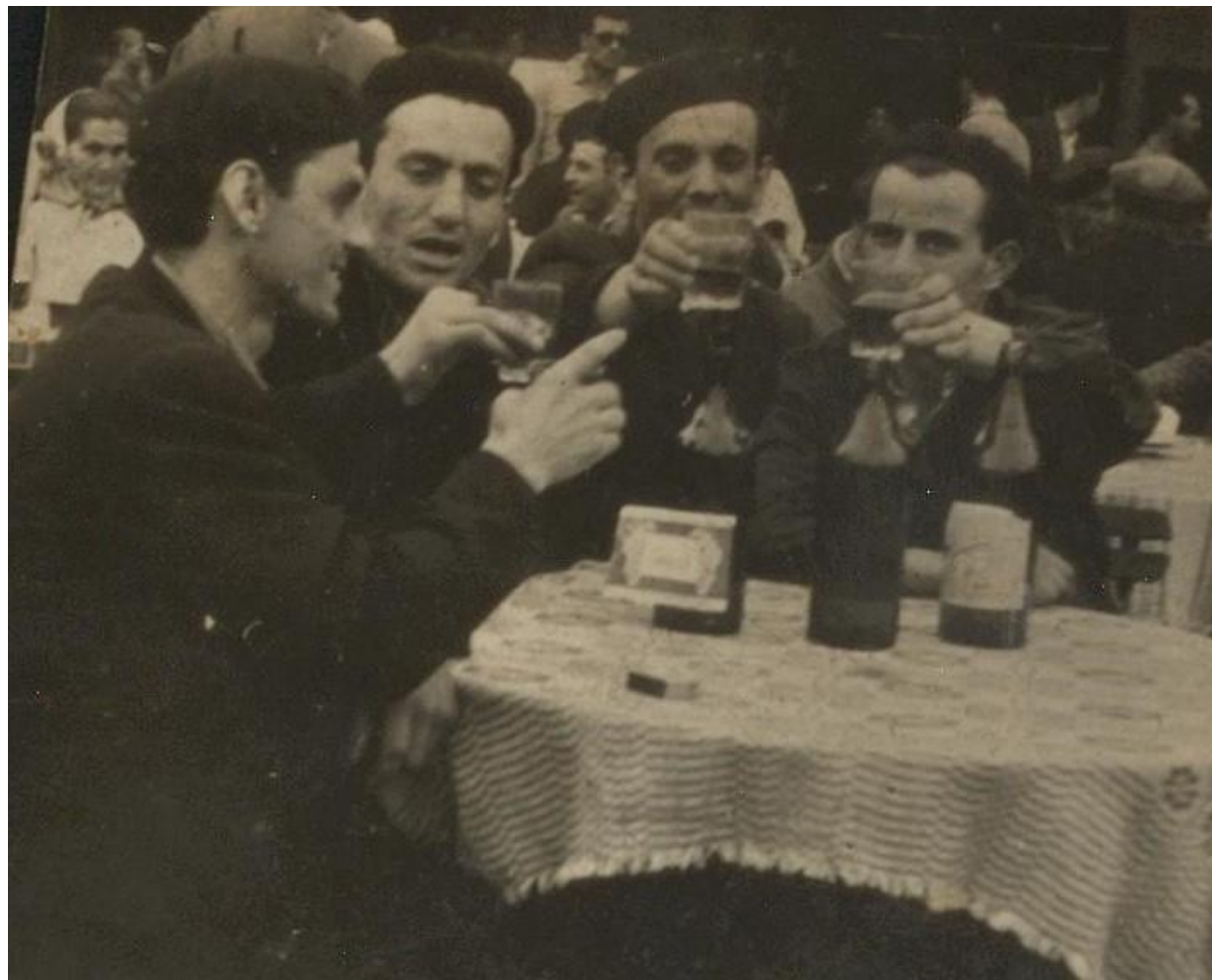
După muncă la bufetul din sat (1970)

Proiect finanțat de Ministerul Culturii și Identității Naționale Beneficiarul proiectului: Județul Satu Mare, Consiliul Județean Implementat și coordonat de Biblioteca Județeană Satu Mare