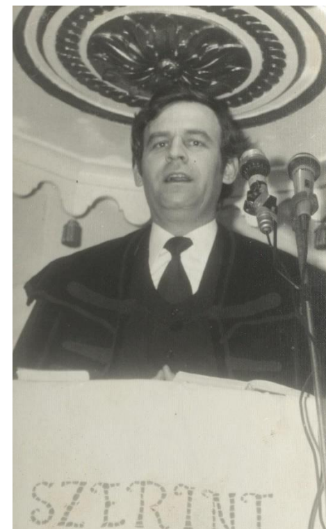
Pastorul Laszlo Tokes s-a aflat în mijlocul credincioșilor în 1992

Proiect finanțat de Ministerul Culturii și Identității Naționale Beneficiarul proiectului: Județul Satu Mare, Consiliul Județean Implementat și coordonat de Biblioteca Județeană Satu Mare