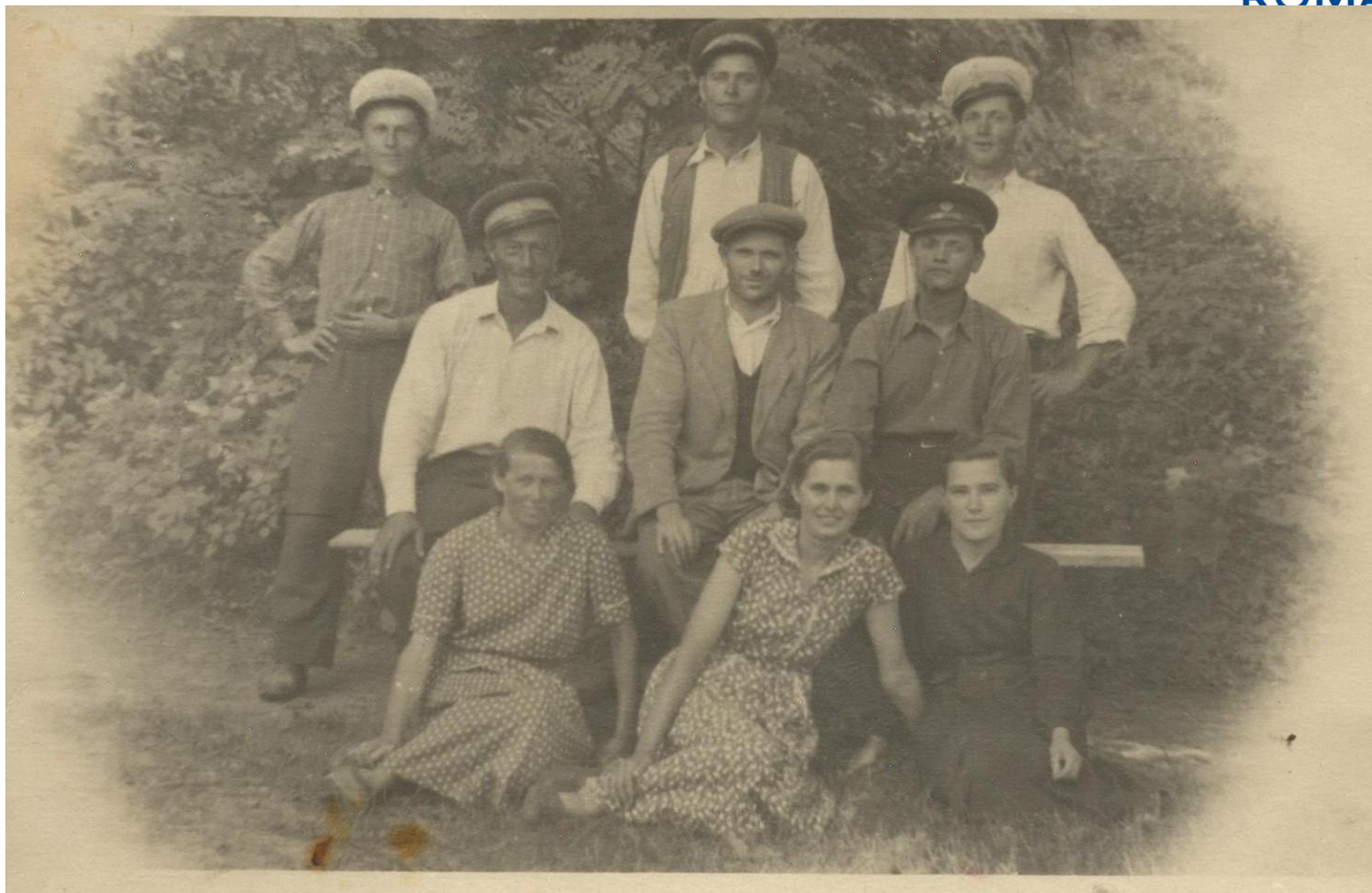
Tineri din Hodod în perioada interbelică

Proiect finanțat de Ministerul Culturii și Identității Naționale Beneficiarul proiectului: Județul Satu Mare, Consiliul Județean Implementat și coordonat de Biblioteca Județeană Satu Mare