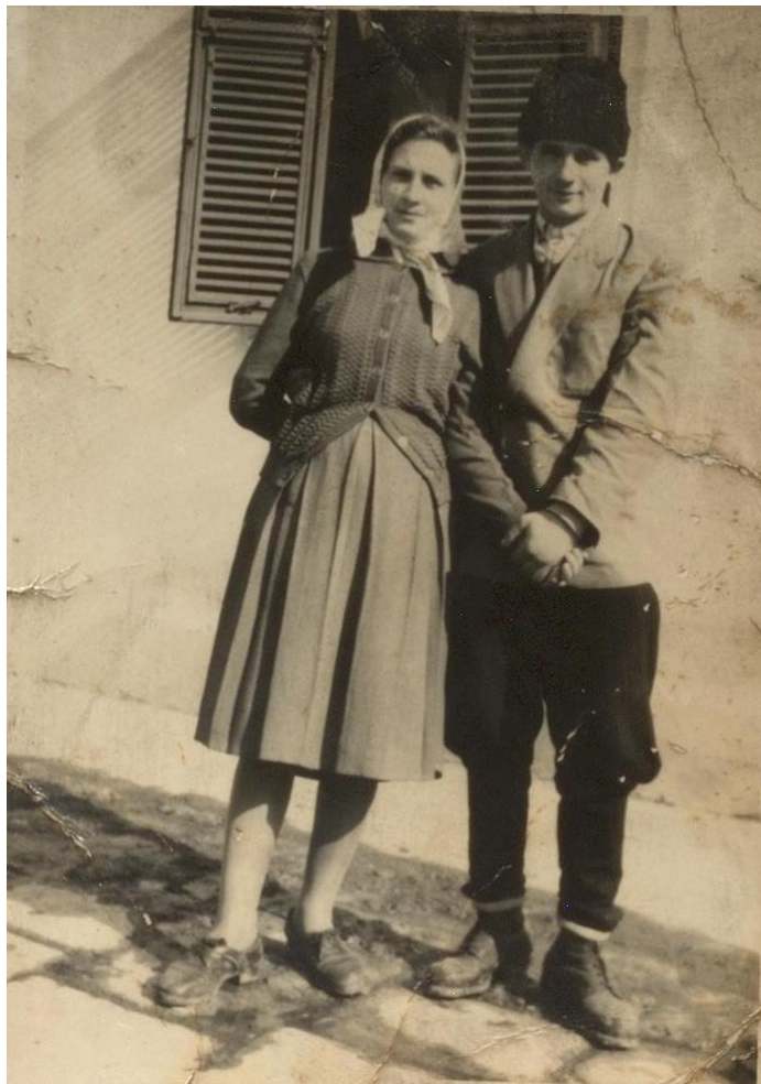
Tineri din Hodod în fața Castelului (1960)