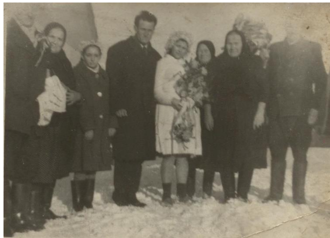
Nuntă în Hodod (1960)