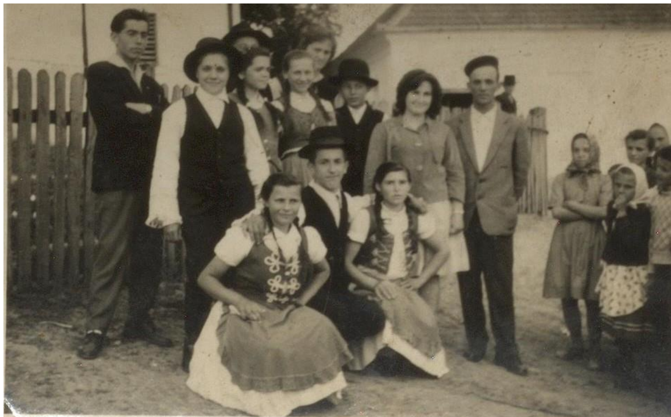
Tineri în costume populare maghiare la un bal din Hodod (1960)