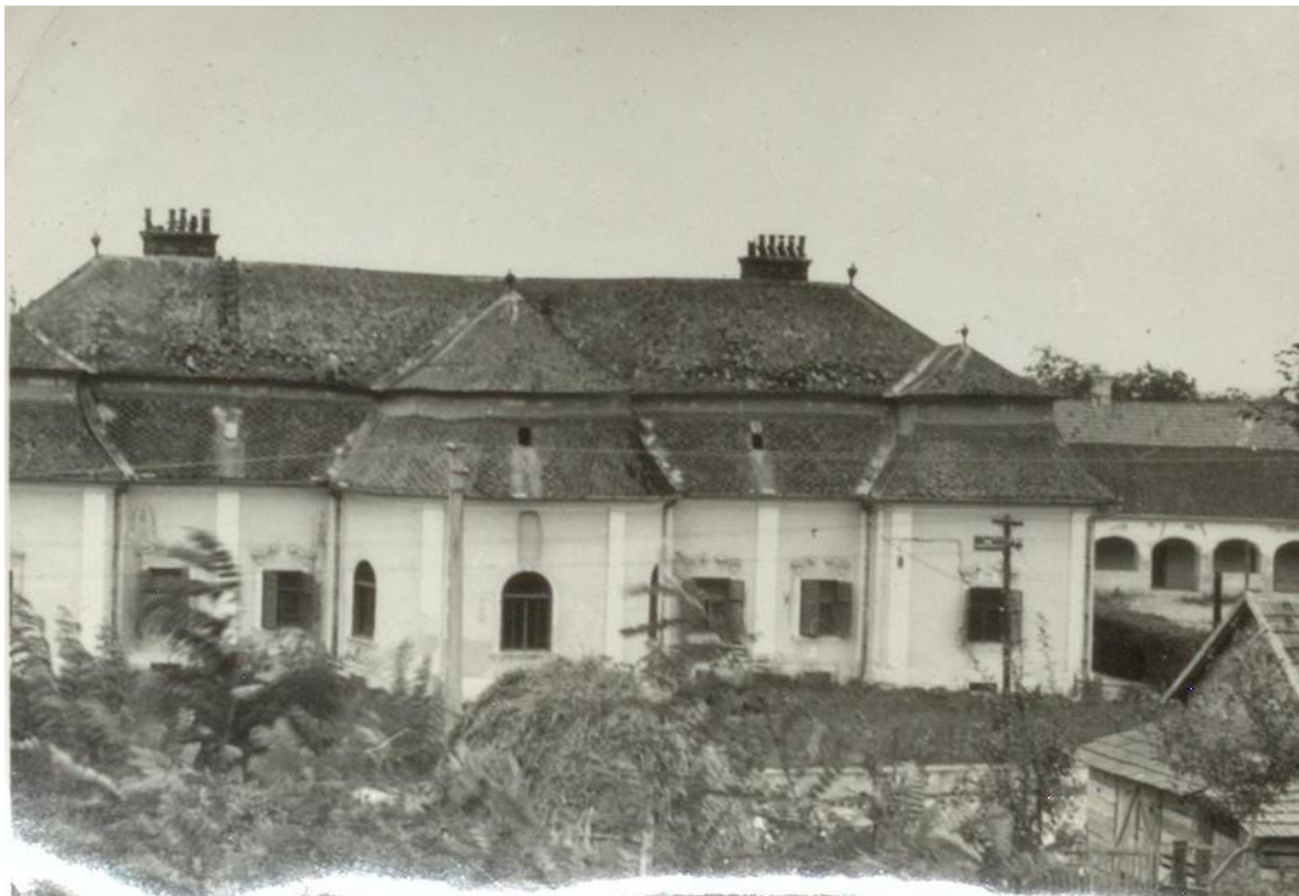
Castelul Weselwnyi (1960)

Proiect finanțat de Ministerul Culturii și Identității Naționale Beneficiarul proiectului: Județul Satu Mare, Consiliul Județean Implementat și coordonat de Biblioteca Județeană Satu Mare