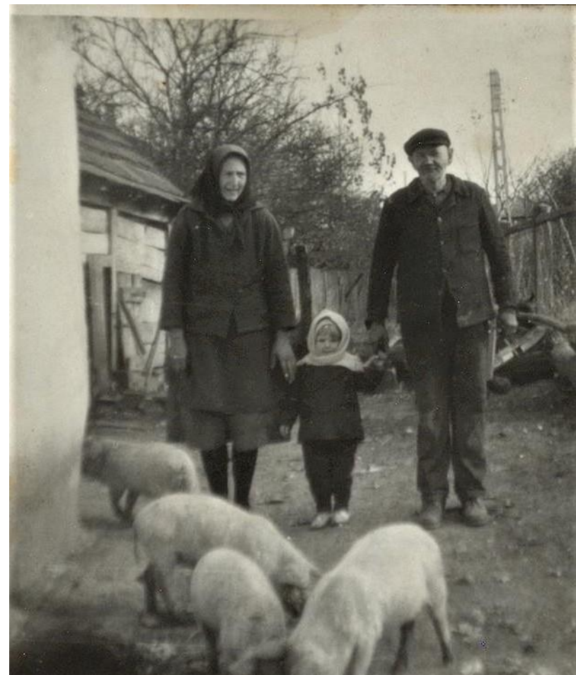
Bunicii și nepoata (1960)

Proiect finanțat de Ministerul Culturii și Identității Naționale Beneficiarul proiectului: Județul Satu Mare, Consiliul Județean Implementat și coordonat de Biblioteca Județeană Satu Mare