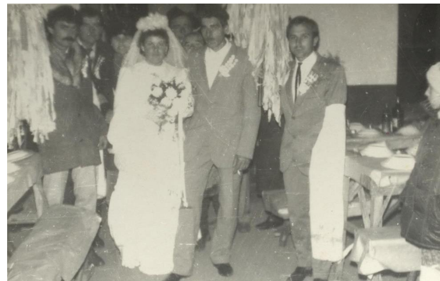
Mirii și starostele la o nuntă din Hodod (1980)