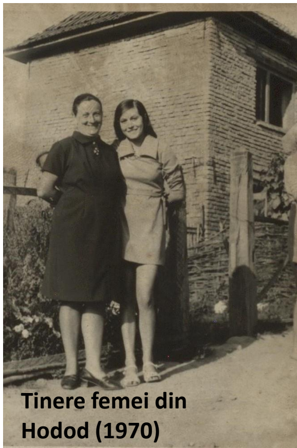
Tinere femei din Hodod (1970)