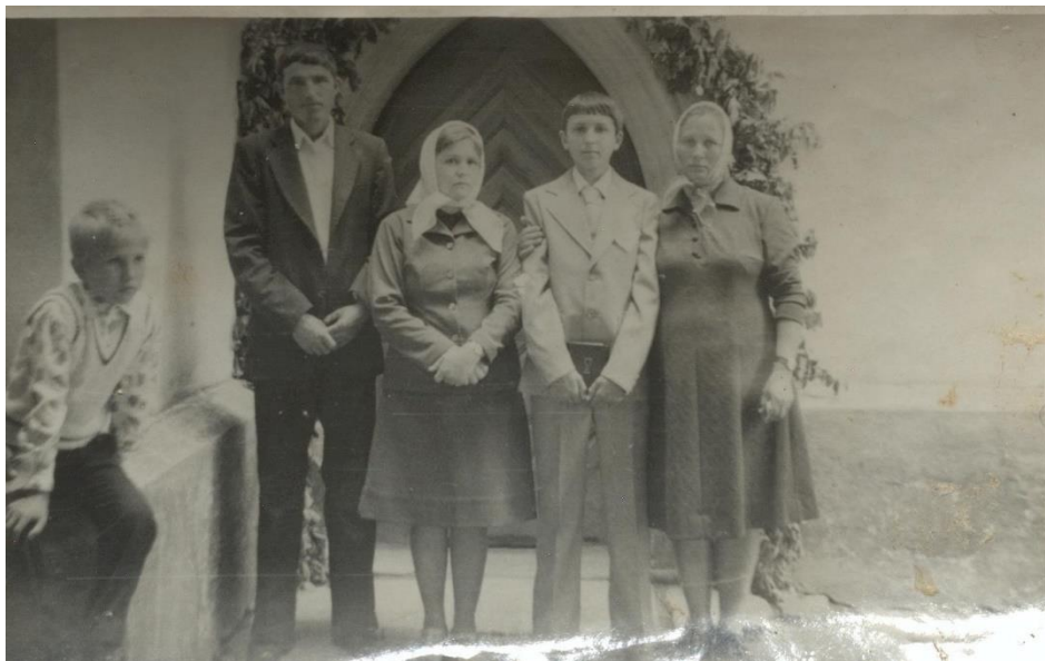
În fața Bisericii Reformate din Hodod la prima împărtășanie