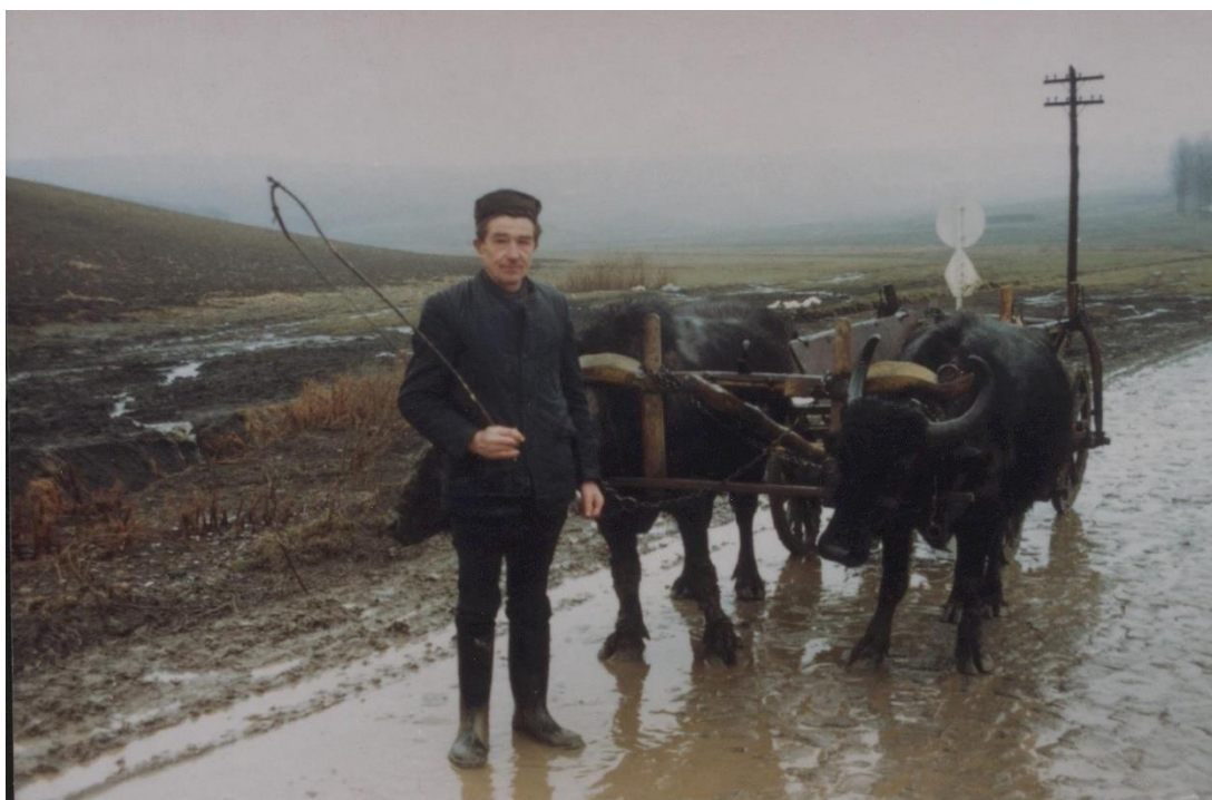
Car tras de bivoli (1991)

Proiect finanțat de Ministerul Culturii și Identității Naționale Beneficiarul proiectului: Județul Satu Mare, Consiliul Județean Implementat și coordonat de Biblioteca Județeană Satu Mare