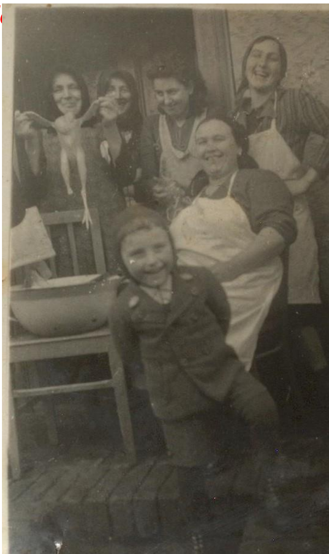
Familia Csanálos (1941) Se pregătește masa de sărbătoare

Proiect finanțat de Ministerul Culturii și Identității Naționale Beneficiarul proiectului: Județul Satu Mare, Consiliul Județean Implementat și coordonat de Biblioteca Județeană Satu Mare