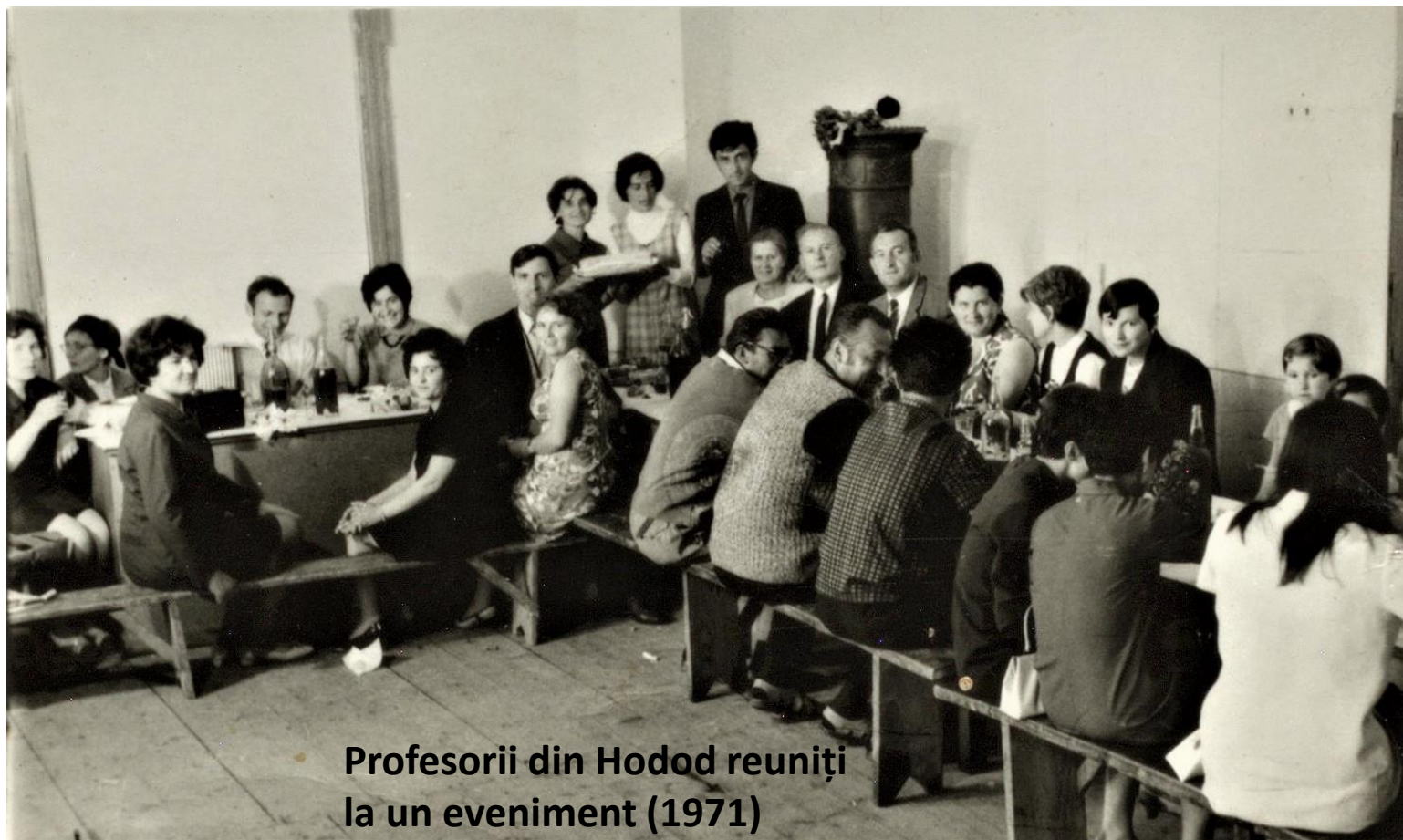
Profesorii din Hodod reuniți la un eveniment (1971)

Proiect finanțat de Ministerul Culturii și Identității Naționale Beneficiarul proiectului: Județul Satu Mare, Consiliul Județean Implementat și coordonat de Biblioteca Județeană Satu Mare