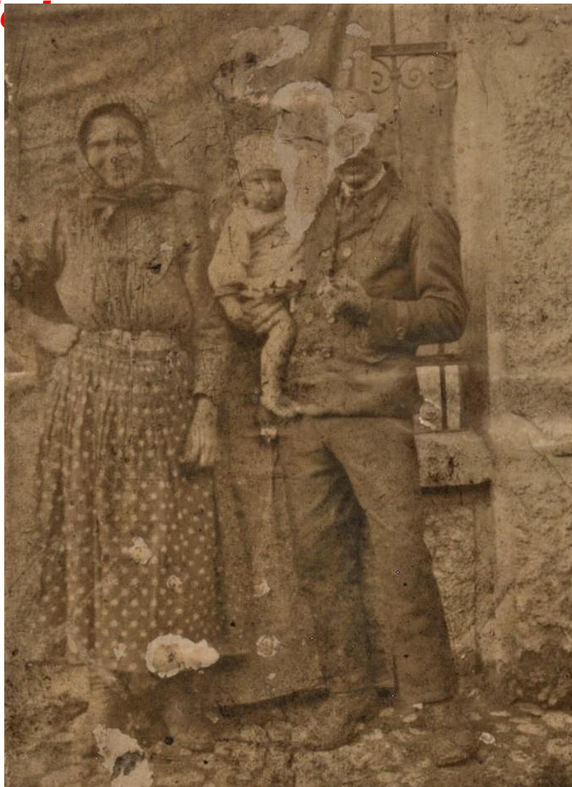
Familie din Hodod în haine tradiționale (1940)

Proiect finanțat de Ministerul Culturii și Identității Naționale Beneficiarul proiectului: Județul Satu Mare, Consiliul Județean Implementat și coordonat de Biblioteca Județeană Satu Mare