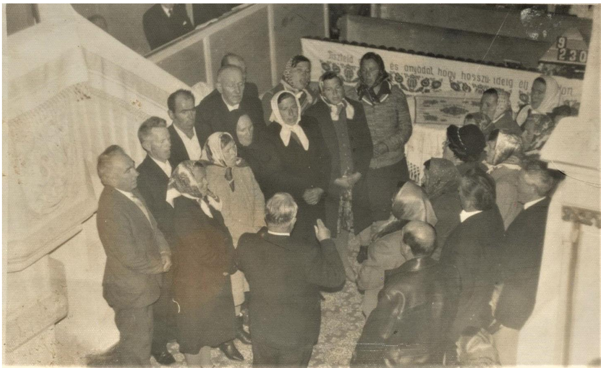
Corul bisericii (1980)