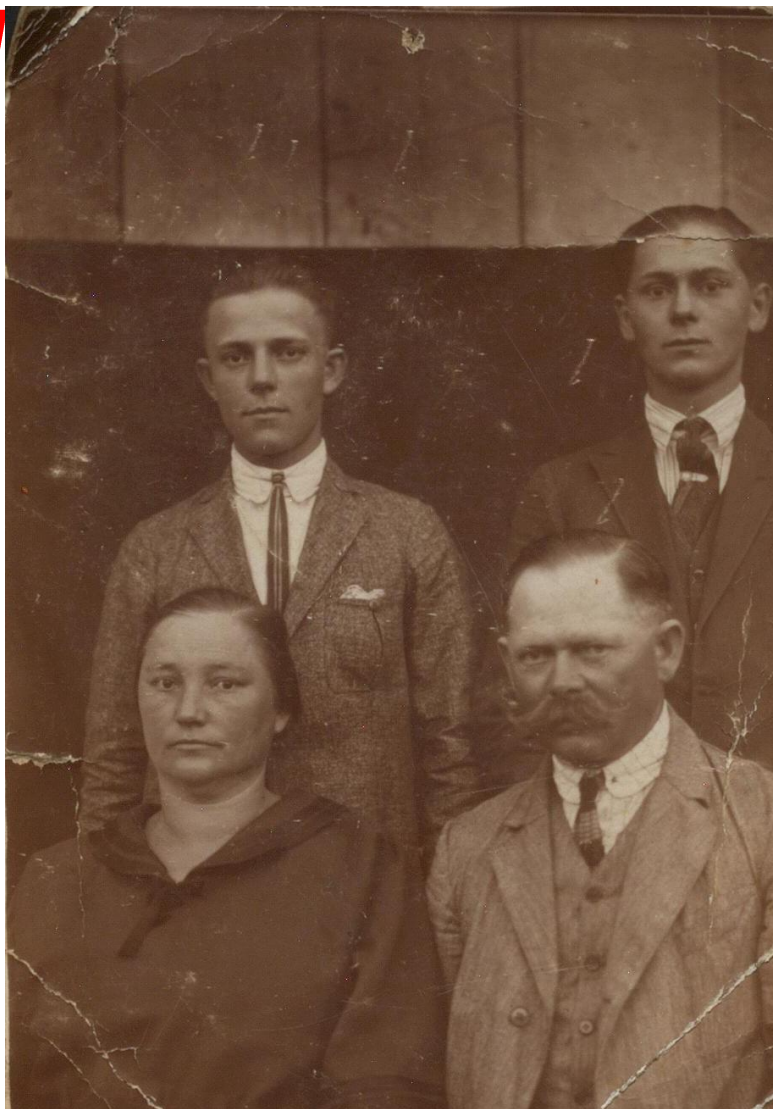
Familie din Hodod în haine de sărbătoare (1950)

Proiect finanțat de Ministerul Culturii și Identității Naționale Beneficiarul proiectului: Județul Satu Mare, Consiliul Județean Implementat și coordonat de Biblioteca Județeană Satu Mare