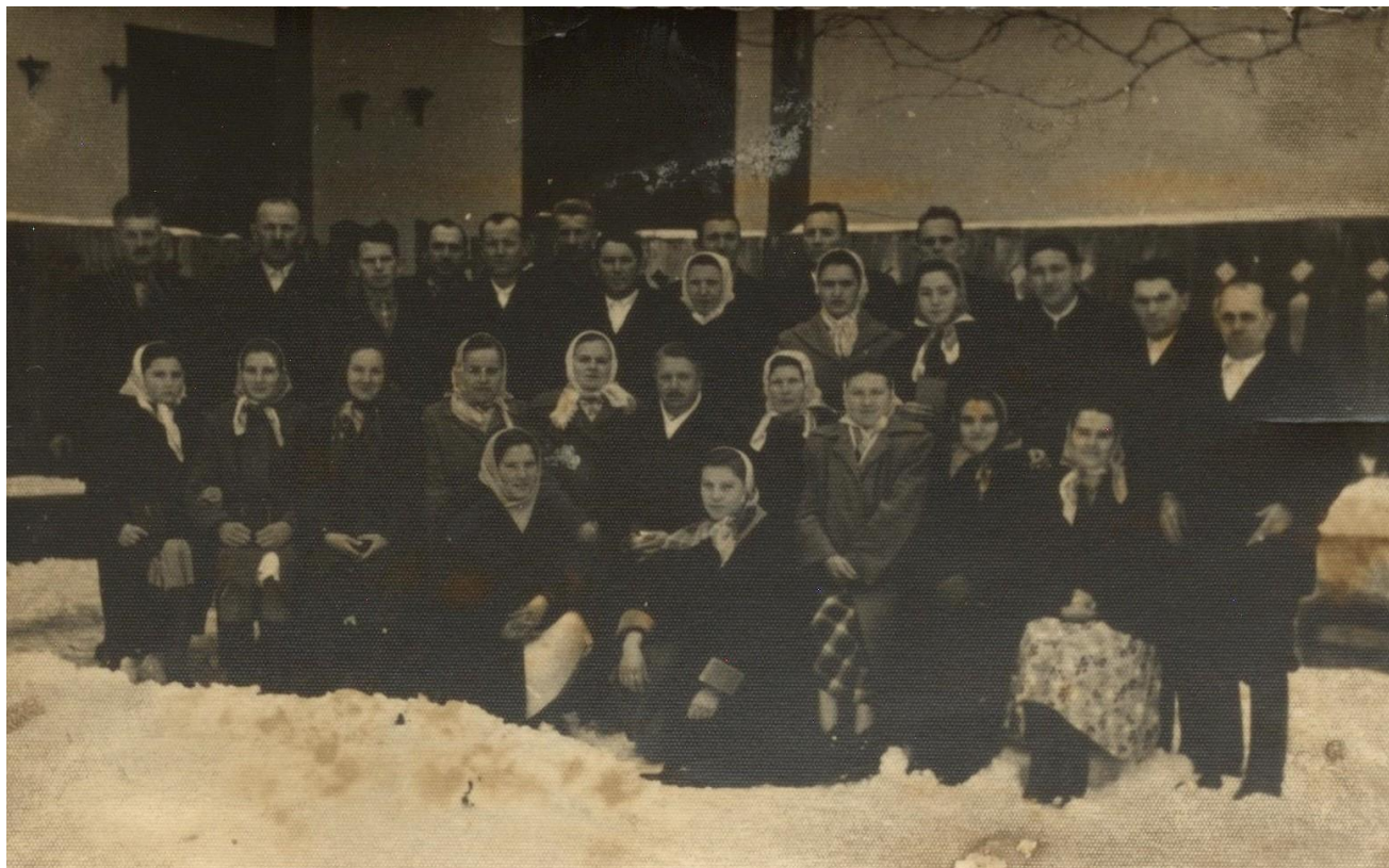
Consiliul parohial (1960)

Proiect finanțat de Ministerul Culturii și Identității Naționale Beneficiarul proiectului: Județul Satu Mare, Consiliul Județean Implementat și coordonat de Biblioteca Județeană Satu Mare