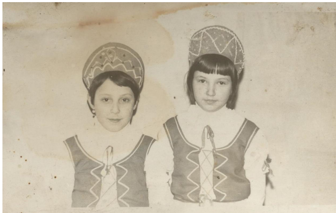
Fetițe în costum popular maghiar din Hodod (1980)