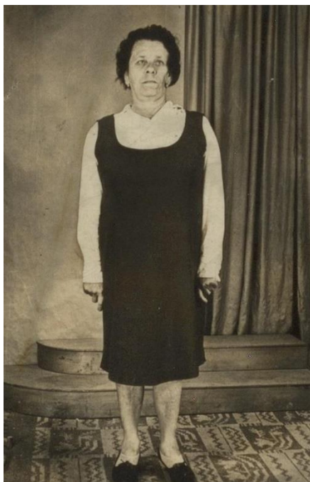
Aniversare. La 61 de ani(1971)