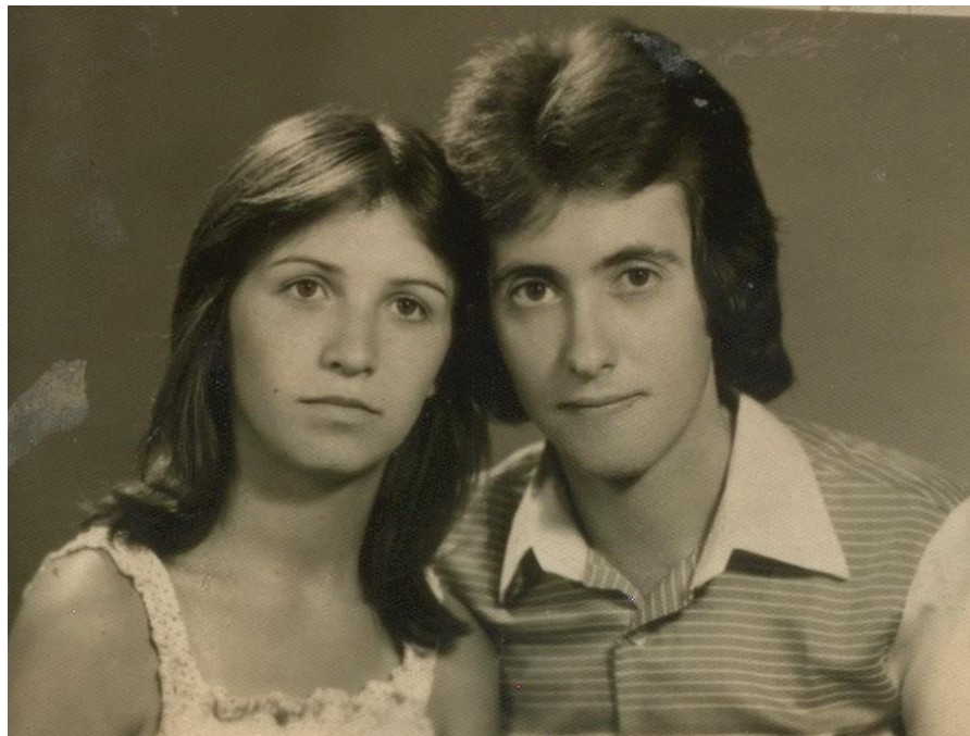
Tineri din Hodod (1979)

În timpul serviciului militar obligatoriu (anii '70)