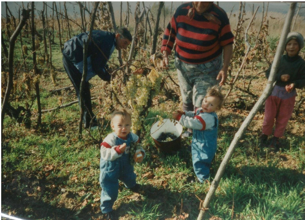
Mici dar voinici. Două gemene la cules de struguri (1996)

Proiect finanțat de Ministerul Culturii și Identității Naționale Beneficiarul proiectului: Județul Satu Mare, Consiliul Județean Implementat și coordonat de Biblioteca Județeană Satu Mare