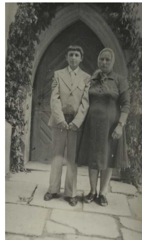
Prima împărtășanie (1980)

Proiect finanțat de Ministerul Culturii și Identității Naționale Beneficiarul proiectului: Județul Satu Mare, Consiliul Județean Implementat și coordonat de Biblioteca Județeană Satu Mare