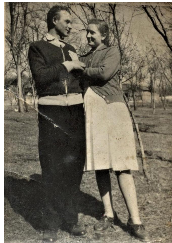
Îndrăgostiți în livadă (1960)

Proiect finanțat de Ministerul Culturii și Identității Naționale Beneficiarul proiectului: Județul Satu Mare, Consiliul Județean Implementat și coordonat de Biblioteca Județeană Satu Mare