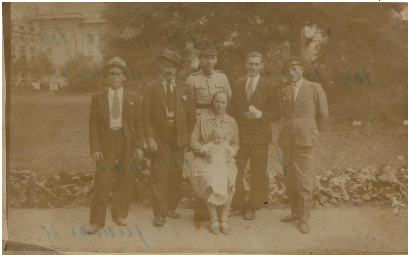
Familie din Hodod - 1928

Proiect finanțat de Ministerul Culturii și Identității Naționale Beneficiarul proiectului: Județul Satu Mare, Consiliul Județean Implementat și coordonat de Biblioteca Județeană Satu Mare