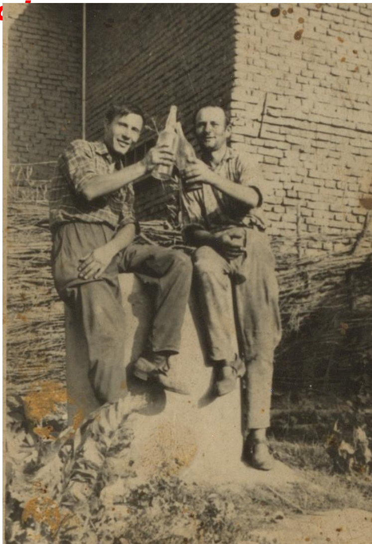
Constructori într-o pauză de lucru (1960)

Proiect finanțat de Ministerul Culturii și Identității Naționale Beneficiarul proiectului: Județul Satu Mare, Consiliul Județean Implementat și coordonat de Biblioteca Județeană Satu Mare