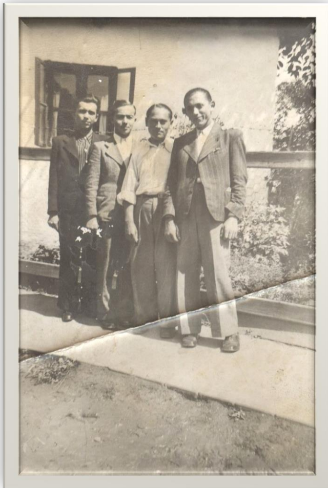
În curtea casei părintești - 1938

Proiect finanțat de Ministerul Culturii și Identității Naționale Beneficiarul proiectului: Județul Satu Mare, Consiliul Județean Implementat și coordonat de Biblioteca Județeană Satu Mare