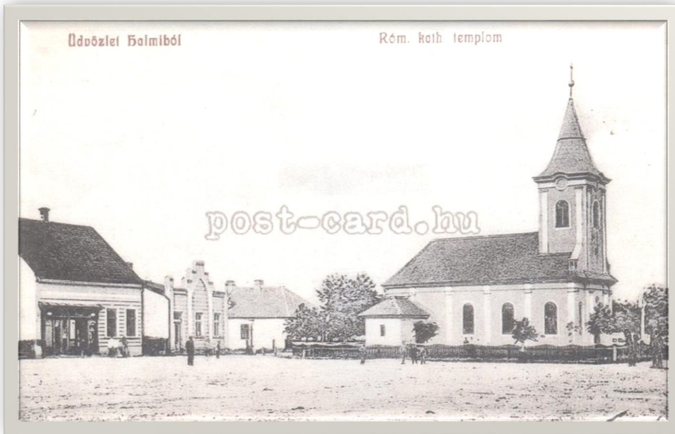
Biserica Romano-Catolică din Halmeu - 1920