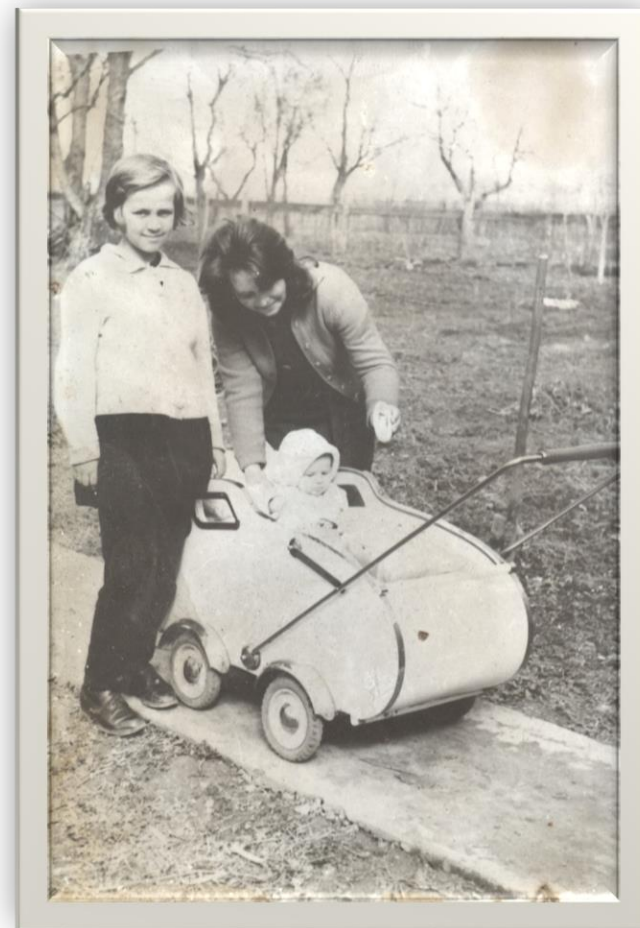
Copil în landou - 1964