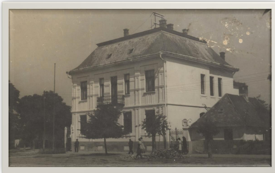
Primăria din Halmeu - 1943, verso – Carte poștală

Proiect finanțat de Ministerul Culturii și Identității Naționale Beneficiarul proiectului: Județul Satu Mare, Consiliul Județean Implementat și coordonat de Biblioteca Județeană Satu Mare