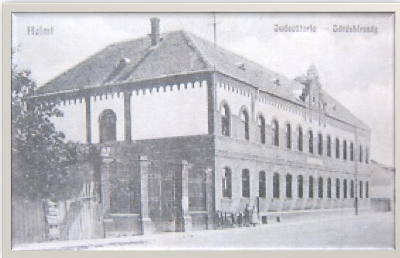
Judecătoria din Halmeu – 1930, azi aici funcționează Școala generală

Proiect finanțat de Ministerul Culturii și Identității Naționale Beneficiarul proiectului: Județul Satu Mare, Consiliul Județean Implementat și coordonat de Biblioteca Județeană Satu Mare