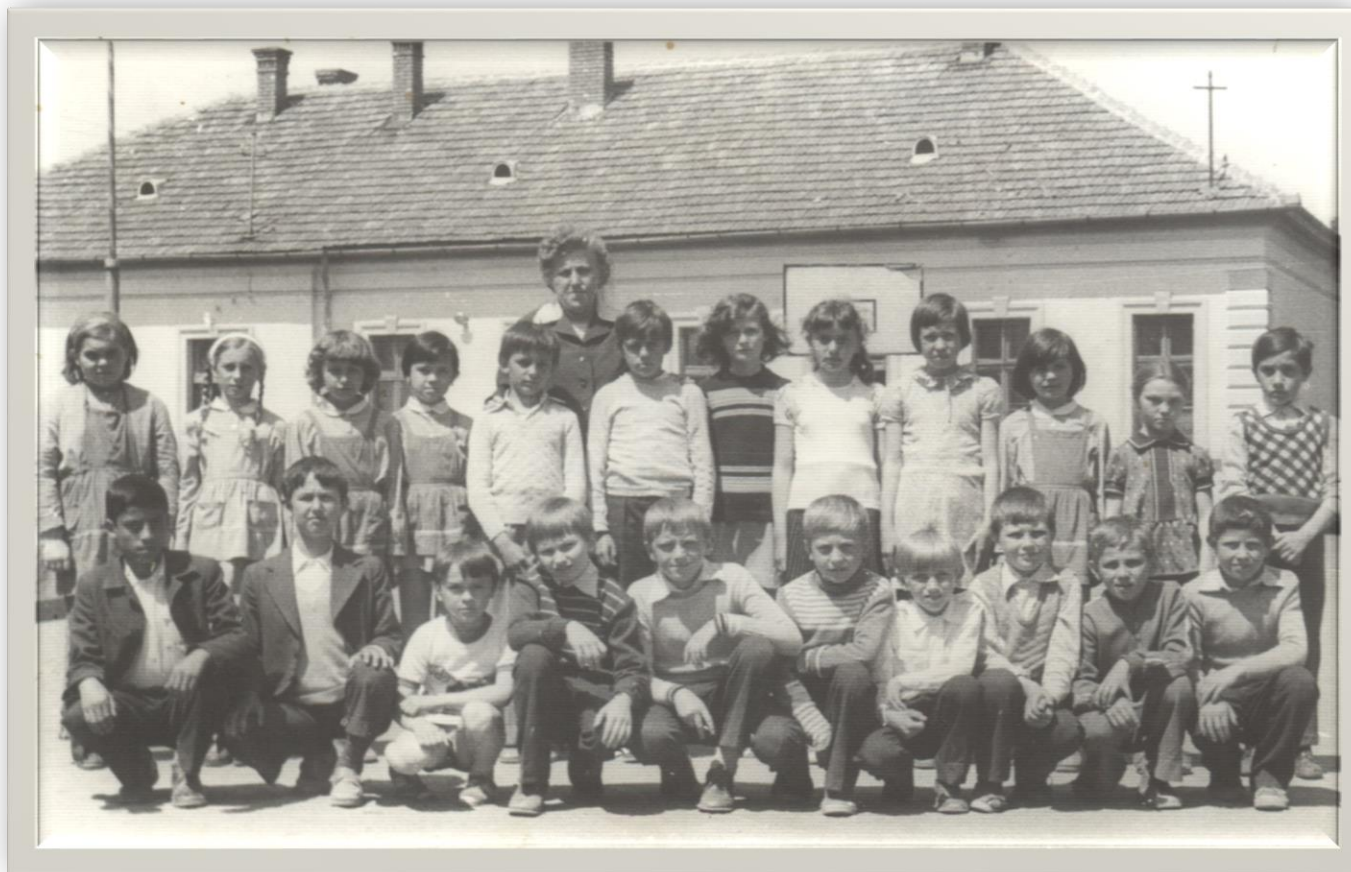
Sfârșit de an școlar la Școala din Halmeu - 1980

Proiect finanțat de Ministerul Culturii și Identității Naționale Beneficiarul proiectului: Județul Satu Mare, Consiliul Județean Implementat și coordonat de Biblioteca Județeană Satu Mare