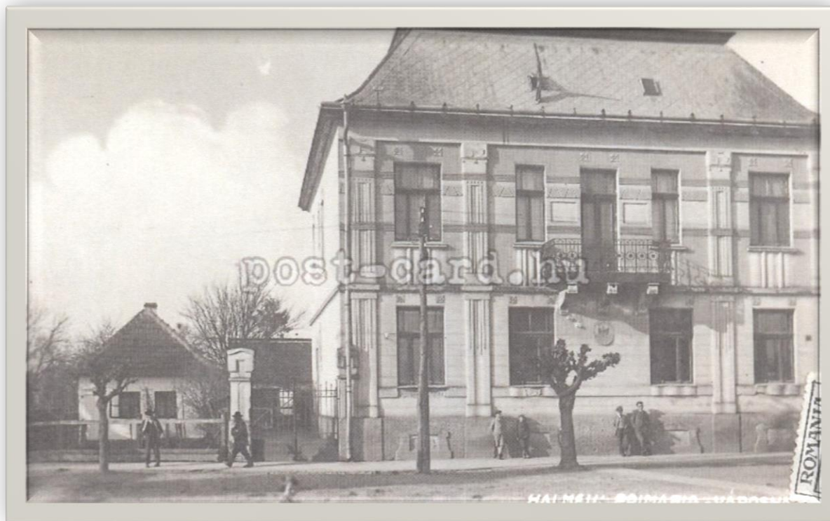
Primăria din Halmeu - 1920/1930

Proiect finanțat de Ministerul Culturii și Identității Naționale Beneficiarul proiectului: Județul Satu Mare, Consiliul Județean Implementat și coordonat de Biblioteca Județeană Satu Mare