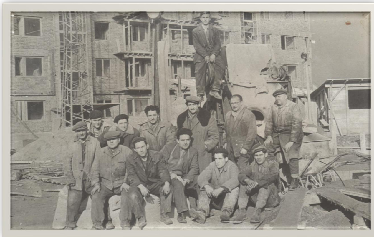
Bărbați din Halmeu la muncă pe șantier

Proiect finanțat de Ministerul Culturii și Identității Naționale Beneficiarul proiectului: Județul Satu Mare, Consiliul Județean Implementat și coordonat de Biblioteca Județeană Satu Mare