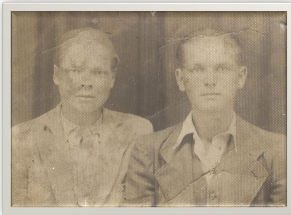
Doi frați din Halmeu înainte de a pleca pe front

Proiect finanțat de Ministerul Culturii și Identității Naționale Beneficiarul proiectului: Județul Satu Mare, Consiliul Județean Implementat și coordonat de Biblioteca Județeană Satu Mare