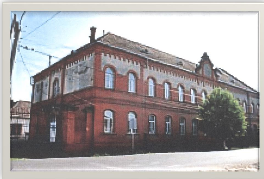
Școala Gimnazială Halmeu - 2017

Proiect finanțat de Ministerul Culturii și Identității Naționale Beneficiarul proiectului: Județul Satu Mare, Consiliul Județean Implementat și coordonat de Biblioteca Județeană Satu Mare