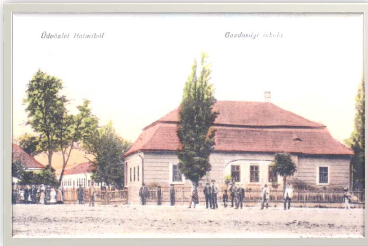
Școala agricolă din Halmeu - 1920

Proiect finanțat de Ministerul Culturii și Identității Naționale Beneficiarul proiectului: Județul Satu Mare, Consiliul Județean Implementat și coordonat de Biblioteca Județeană Satu Mare