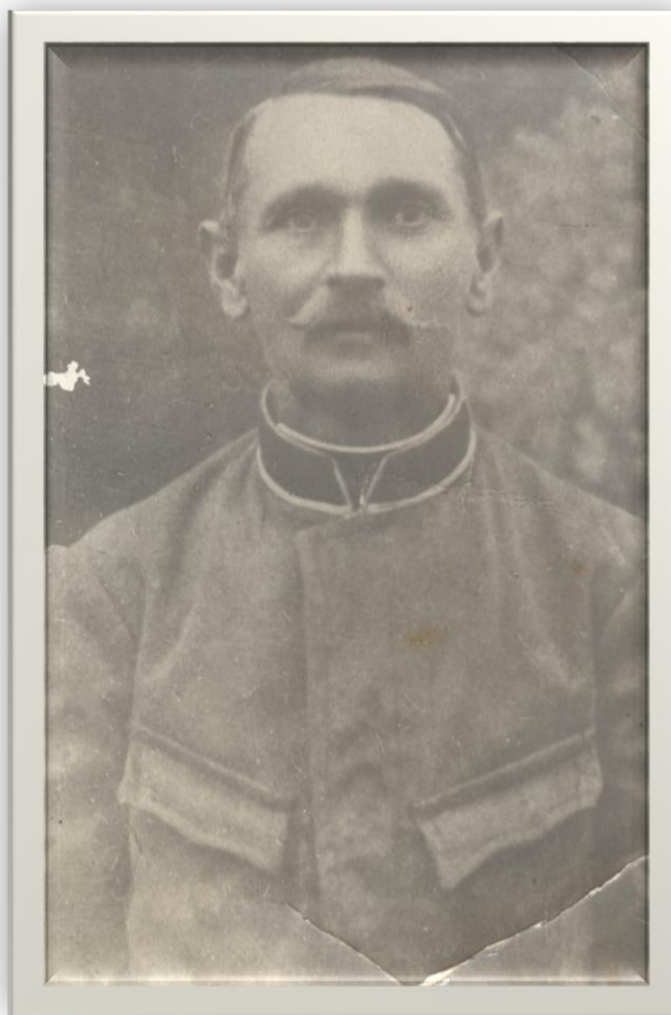
Paznic - 1937

Proiect finanțat de Ministerul Culturii și Identității Naționale Beneficiarul proiectului: Județul Satu Mare, Consiliul Județean Implementat și coordonat de Biblioteca Județeană Satu Mare