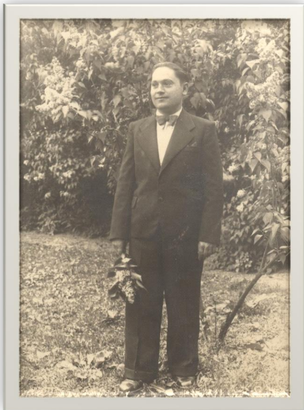
Tânăr din Halmeu - 1937