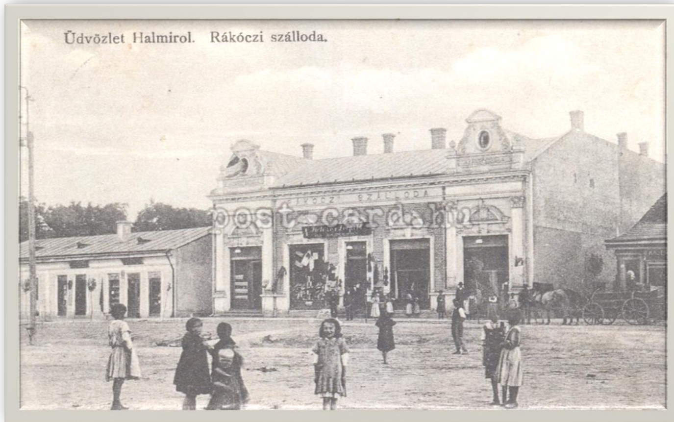
Hotelul Rakoczi din Halmeu - 1930