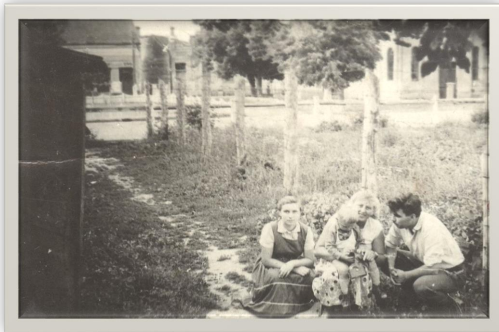
Familie pe o uliță a satului Halmeu - 1960