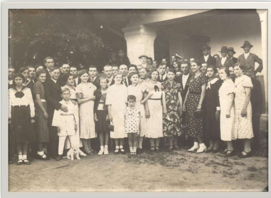
Poză de grup la Balul Halmeului - 1937

Proiect finanțat de Ministerul Culturii și Identității Naționale Beneficiarul proiectului: Județul Satu Mare, Consiliul Județean Implementat și coordonat de Biblioteca Județeană Satu Mare