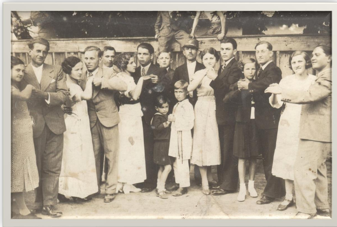
Balul Halmeului la Restaurantul Rakoczi - 1937

Proiect finanțat de Ministerul Culturii și Identității Naționale Beneficiarul proiectului: Județul Satu Mare, Consiliul Județean Implementat și coordonat de Biblioteca Județeană Satu Mare