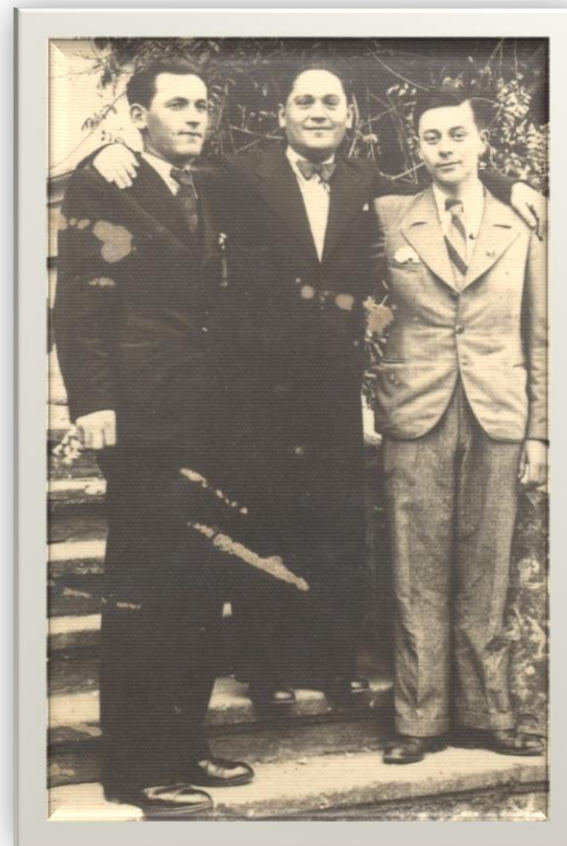
Grup de tineri în fața conacului Kazanyi - 1937

Proiect finanțat de Ministerul Culturii și Identității Naționale Beneficiarul proiectului: Județul Satu Mare, Consiliul Județean Implementat și coordonat de Biblioteca Județeană Satu Mare