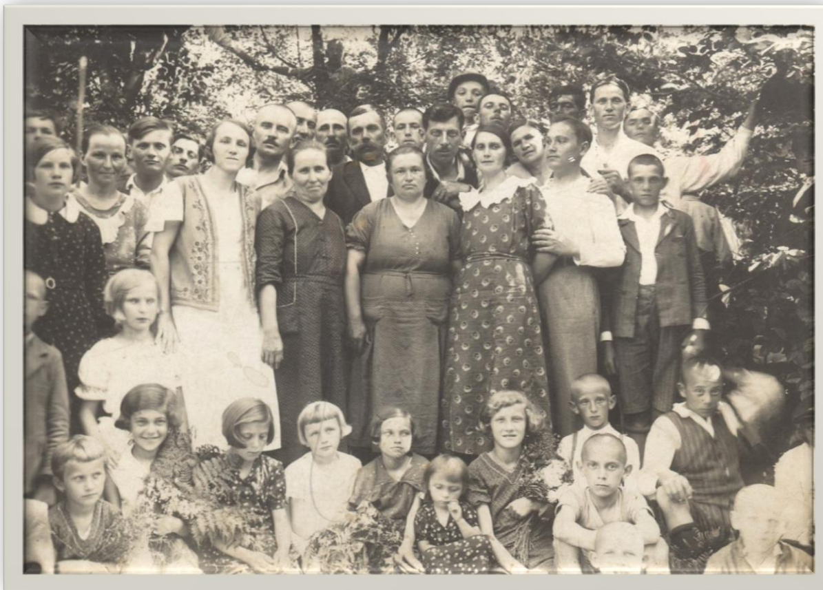
Grup de tineri la Halmeu Vii - 1937

Proiect finanțat de Ministerul Culturii și Identității Naționale Beneficiarul proiectului: Județul Satu Mare, Consiliul Județean Implementat și coordonat de Biblioteca Județeană Satu Mare