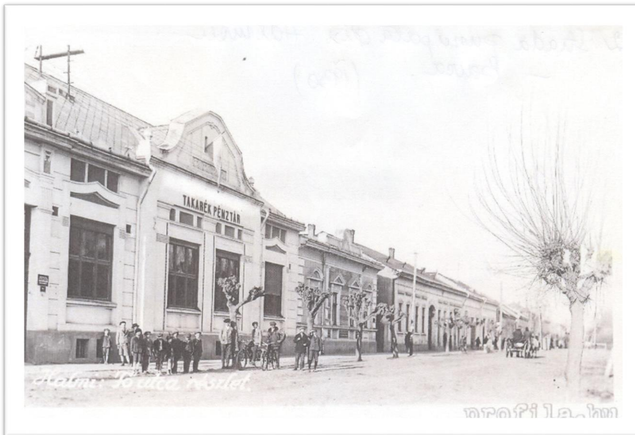
Strada principală din Halmeu prin anii 1930. Banca

Proiect finanțat de Ministerul Culturii și Identității Naționale Beneficiarul proiectului: Județul Satu Mare, Consiliul Județean Implementat și coordonat de Biblioteca Județeană Satu Mare