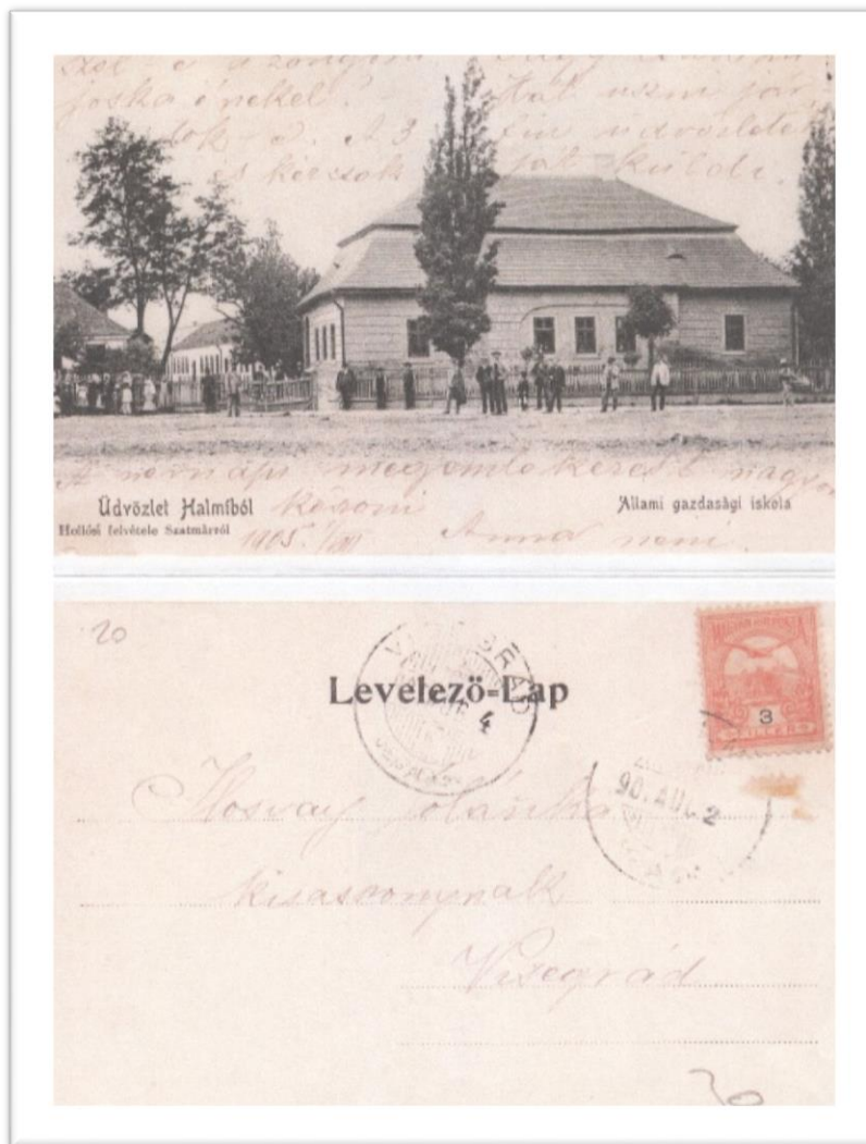
Școala din Halmeu - carte poștală din 1980

Proiect finanțat de Ministerul Culturii și Identității Naționale Beneficiarul proiectului: Județul Satu Mare, Consiliul Județean Implementat și coordonat de Biblioteca Județeană Satu Mare