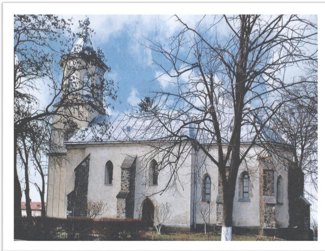
Biserica Reformată din Halmeu - 2017

Proiect finanțat de Ministerul Culturii și Identității Naționale Beneficiarul proiectului: Județul Satu Mare, Consiliul Județean Implementat și coordonat de Biblioteca Județeană Satu Mare