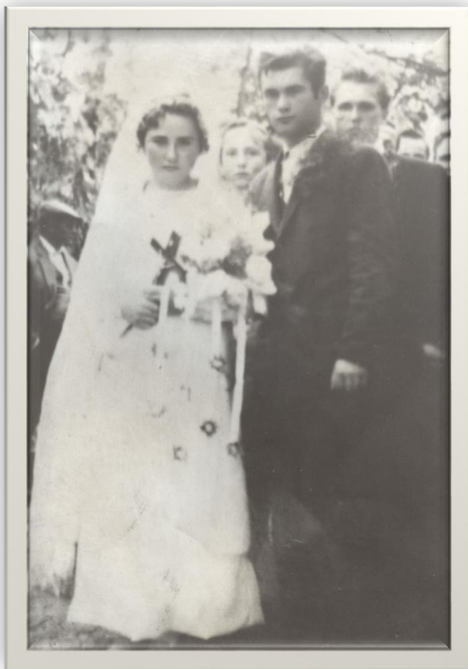
Alai de nuntă din Halmeu. Tinerii conducând mireasa - 1965

Proiect finanțat de Ministerul Culturii și Identității Naționale Beneficiarul proiectului: Județul Satu Mare, Consiliul Județean Implementat și coordonat de Biblioteca Județeană Satu Mare