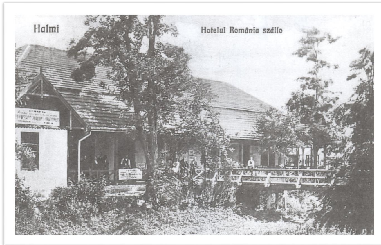
Hotelul România – Halmeu 1920/1930