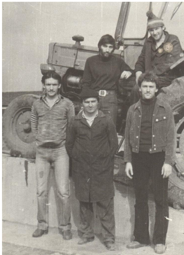
ÎN PRACTICĂ AGRICOLĂ - 1980/1981

Proiect finanțat de Ministerul Culturii și Identității Naționale Beneficiarul proiectului: Județul Satu Mare, Consiliul Județean Implementat și coordonat de Biblioteca Județeană Satu Mare