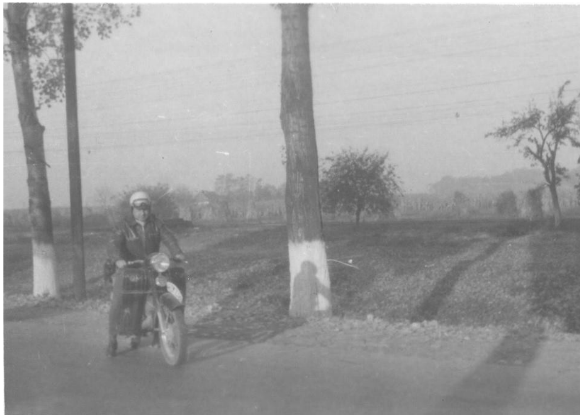
ȘOSEAUA CE TRAVERSEAZĂ LOCALITATEA BOTIZ, DN 19 - 1940

Proiect finanțat de Ministerul Culturii și Identității Naționale Beneficiarul proiectului: Județul Satu Mare, Consiliul Județean Implementat și coordonat de Biblioteca Județeană Satu Mare