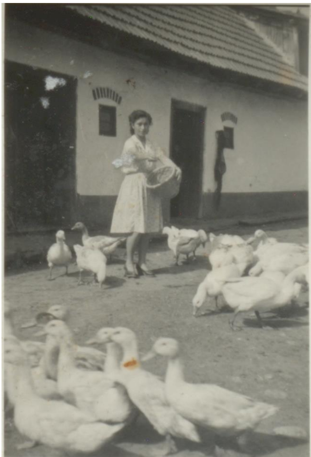
GOSPODĂRIE DE PE STRADA TEILOR - 1943