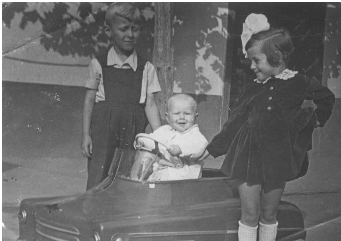
ÎN CURTEA BUNICILOR ROCA - 1950

Proiect finanțat de Ministerul Culturii și Identității Naționale Beneficiarul proiectului: Județul Satu Mare, Consiliul Județean Implementat și coordonat de Biblioteca Județeană Satu Mare