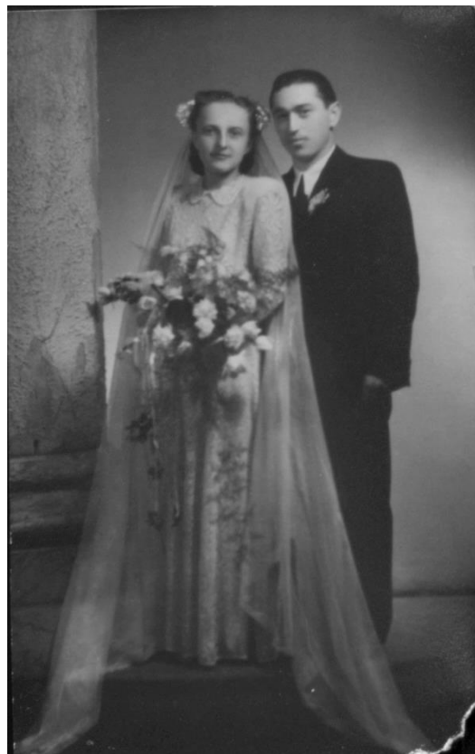
MIRI, 1956, FAM. ROCA