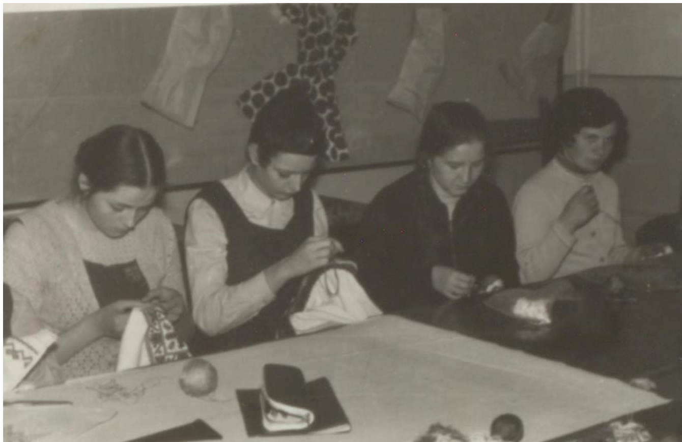
LA ȘCOALĂ, ORA DE LUCRU MANUAL - 1970

Proiect finanțat de Ministerul Culturii și Identității Naționale Beneficiarul proiectului: Județul Satu Mare, Consiliul Județean Implementat și coordonat de Biblioteca Județeană Satu Mare