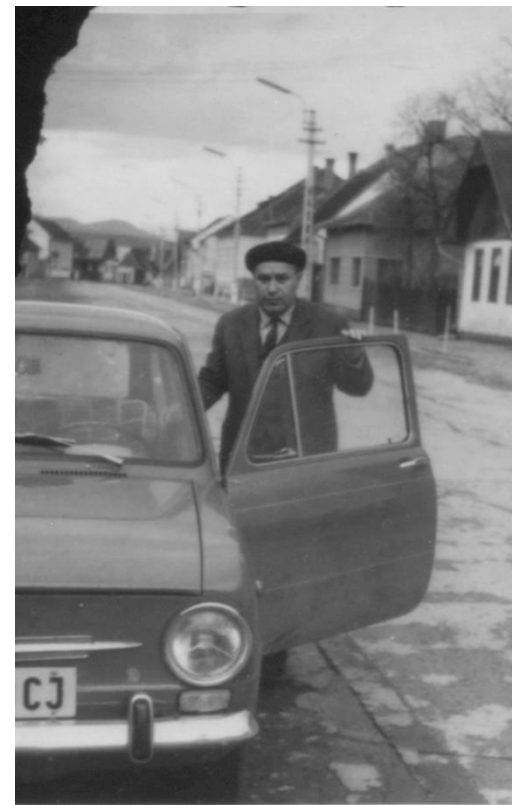
MAȘINA CARE A FĂCUT TURUL ROMÂNIEI - 1970

Proiect finanțat de Ministerul Culturii și Identității Naționale Beneficiarul proiectului: Județul Satu Mare, Consiliul Județean Implementat și coordonat de Biblioteca Județeană Satu Mare