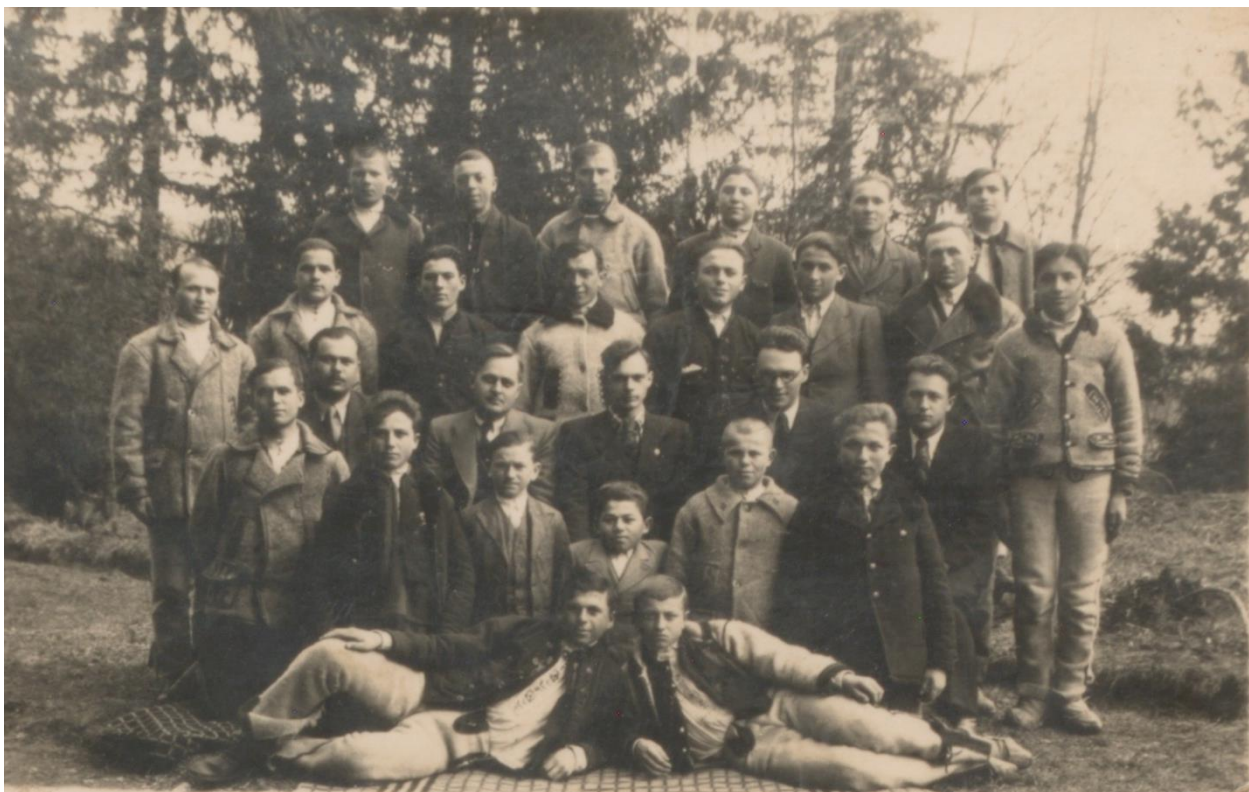
ȘCOALA DE BĂIEȚI - 1938 (ZAHA CORIOLAN)

Proiect finanțat de Ministerul Culturii și Identității Naționale Beneficiarul proiectului: Județul Satu Mare, Consiliul Județean Implementat și coordonat de Biblioteca Județeană Satu Mare