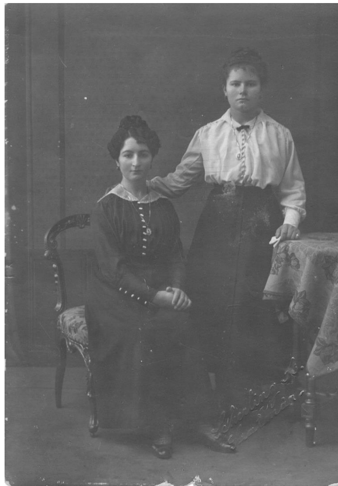
SURORILE ANDREICA DIN BOTIZ - 1918

Proiect finanțat de Ministerul Culturii și Identității Naționale Beneficiarul proiectului: Județul Satu Mare, Consiliul Județean Implementat și coordonat de Biblioteca Județeană Satu Mare