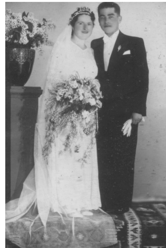
MIRI, FAM. ROCA