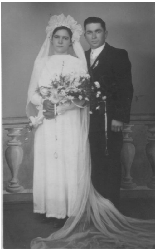
MIRI, 1948, FAM. ROCA