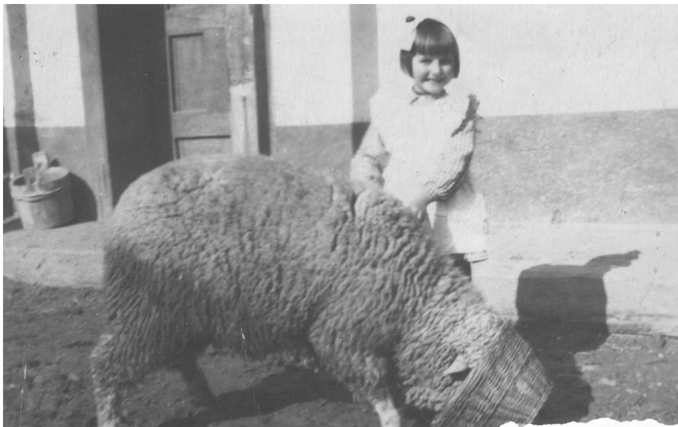
COPII ÎN CURTEA CASEI - 1956

Proiect finanțat de Ministerul Culturii și Identității Naționale Beneficiarul proiectului: Județul Satu Mare, Consiliul Județean Implementat și coordonat de Biblioteca Județeană Satu Mare