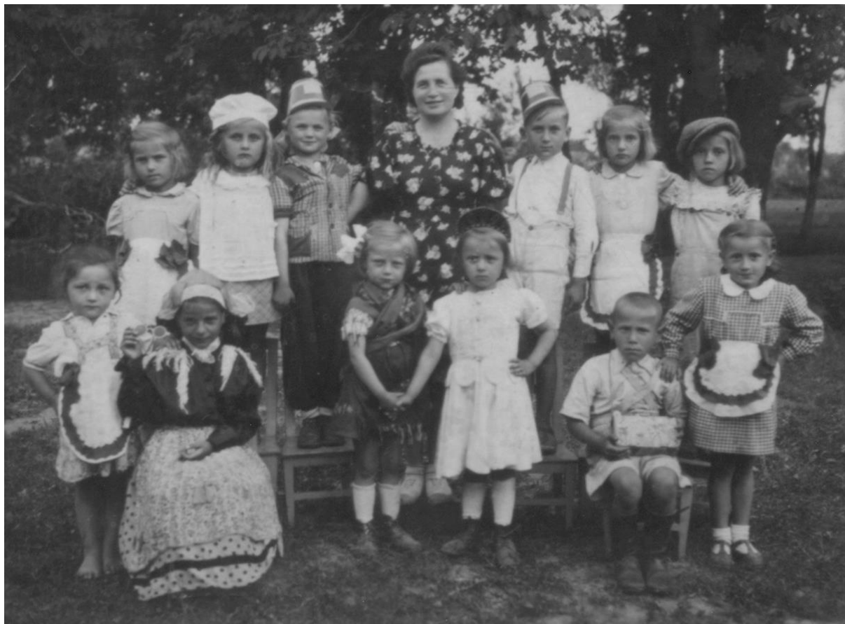
GRĂDINIȚA BOTIZ - 1949

Proiect finanțat de Ministerul Culturii și Identității Naționale Beneficiarul proiectului: Județul Satu Mare, Consiliul Județean Implementat și coordonat de Biblioteca Județeană Satu Mare