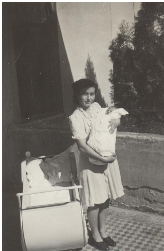
LA PLIMBARE - 1943

Proiect finanțat de Ministerul Culturii și Identității Naționale Beneficiarul proiectului: Județul Satu Mare, Consiliul Județean Implementat și coordonat de Biblioteca Județeană Satu Mare