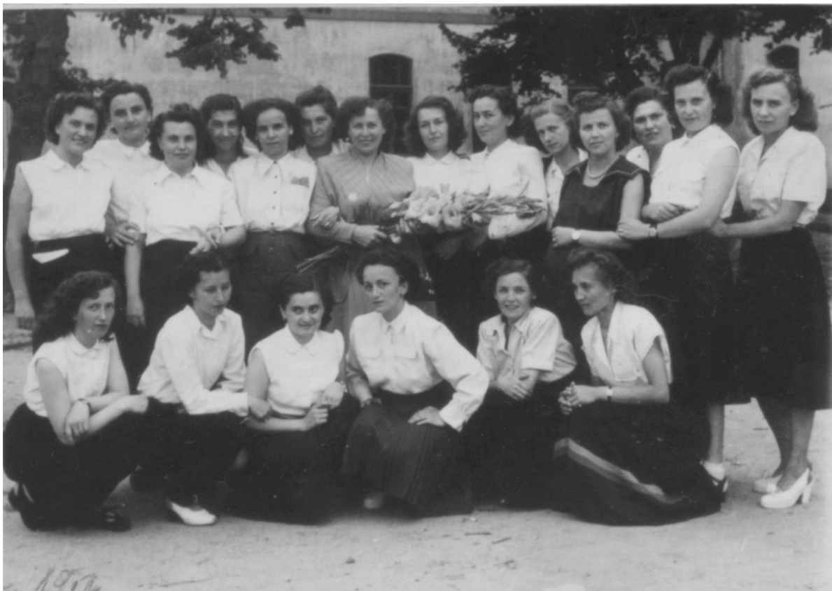
ȘCOALA DE FETE - 1944 (ROCA TEREZIA)

Proiect finanțat de Ministerul Culturii și Identității Naționale Beneficiarul proiectului: Județul Satu Mare, Consiliul Județean Implementat și coordonat de Biblioteca Județeană Satu Mare