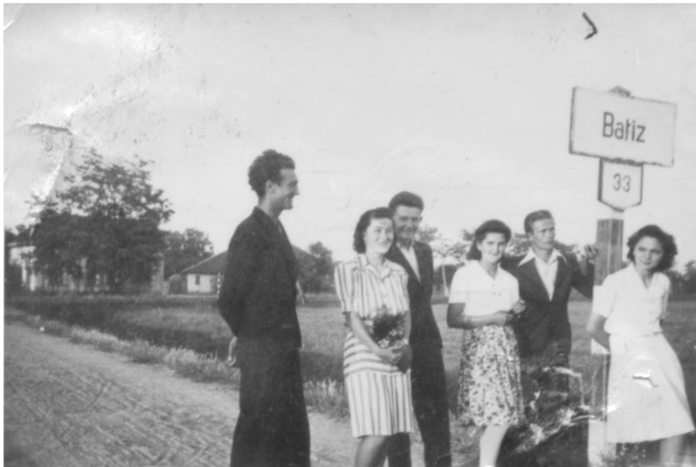
HOTARUL BOTIZULUI, ȘOSEAUA CE STRĂBĂTE LOCALITATEA BOTIZ -