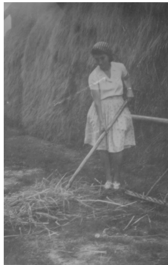
LA FÂN. ÎN GOSPODĂRIE - 29 AUGUST 1942

Proiect finanțat de Ministerul Culturii și Identității Naționale Beneficiarul proiectului: Județul Satu Mare, Consiliul Județean Implementat și coordonat de Biblioteca Județeană Satu Mare