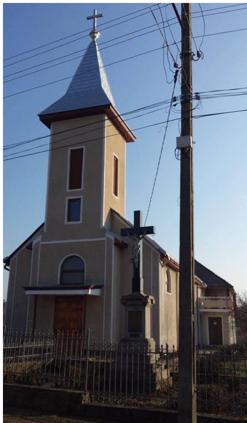
BISERICA ROMANOCATOLICĂ - BOINEȘTI - 2015

Proiect finanțat de Ministerul Culturii și Identității Naționale Beneficiarul proiectului: Județul Satu Mare, Consiliul Județean Implementat și coordonat de Biblioteca Județeană Satu Mare