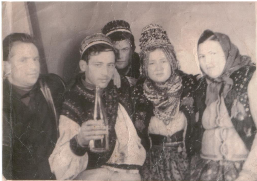
Nuntă în Bixad, 1974.

Mirele cu „cunună”, costum traditional de nuntă