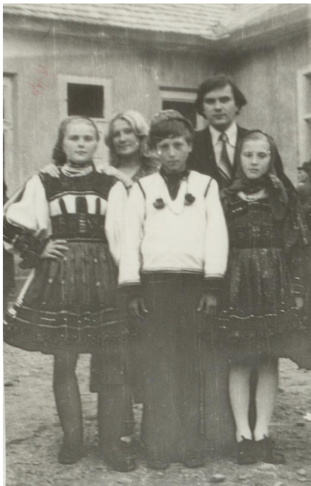
COSTUME TRADIȚIONALE DIN NEGREȘTI-OAȘ - 1980

Proiect finanțat de Ministerul Culturii și Identității Naționale Beneficiarul proiectului: Județul Satu Mare, Consiliul Județean Implementat și coordonat de Biblioteca Județeană Satu Mare