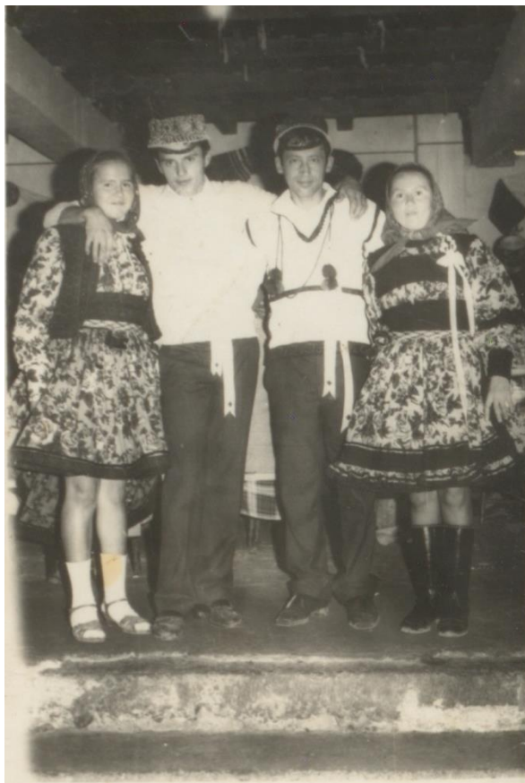
nĂNAȘI LA NUNTĂ ÎN BIXAD, 1982