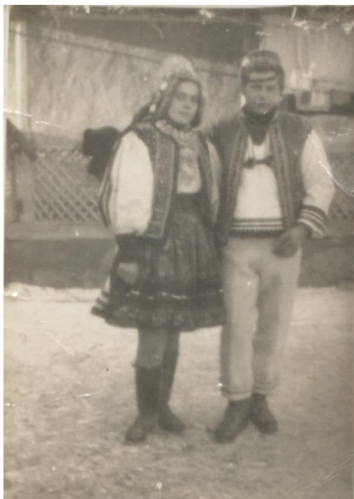
MIREASĂ CU CUNUNĂ ÎN BOINEȘTI - 1980