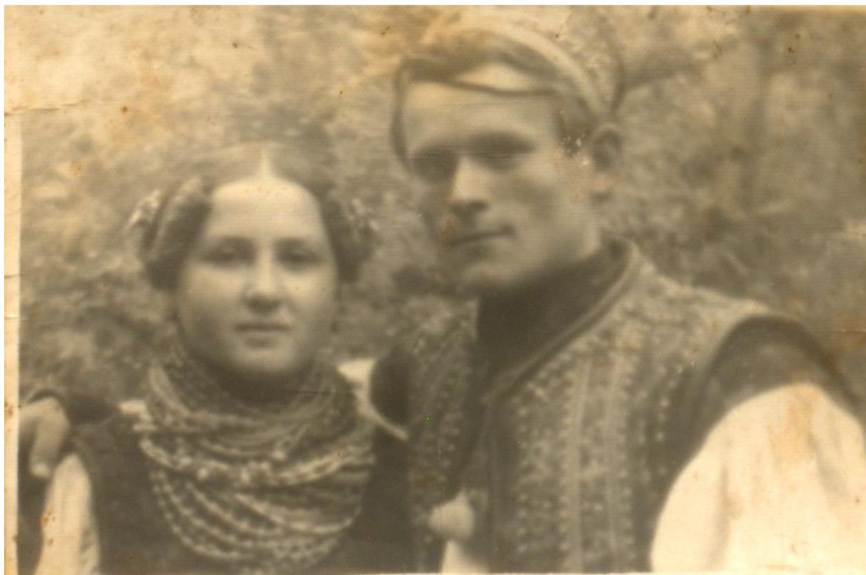
LA DANȚ CU FLORI - 1970

Proiect finanțat de Ministerul Culturii și Identității Naționale Beneficiarul proiectului: Județul Satu Mare, Consiliul Județean Implementat și coordonat de Biblioteca Județeană Satu Mare