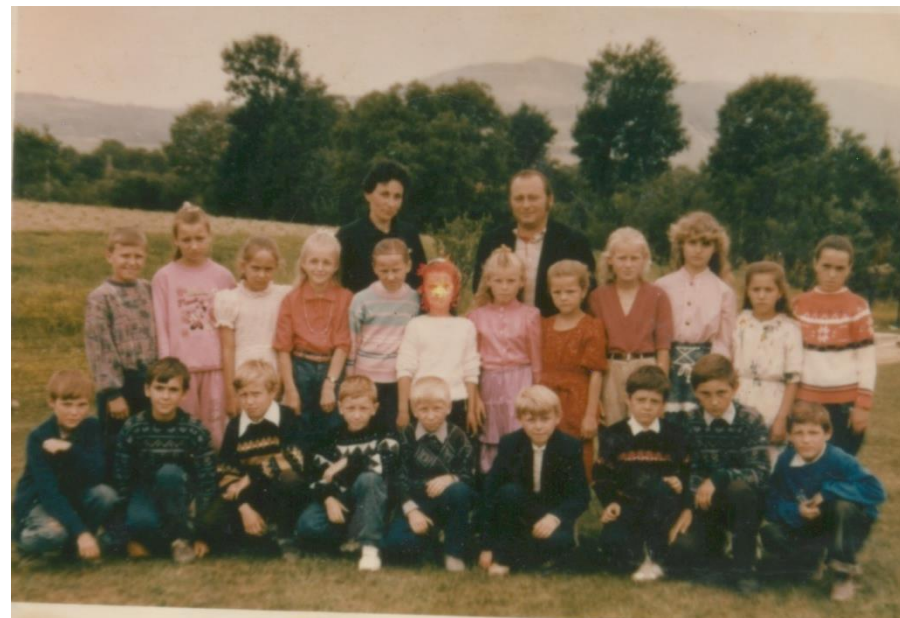
ELEVII CLASEI A 8-A DE LA ȘCOALA DIN BOINEȘTI - 1997

Proiect finanțat de Ministerul Culturii și Identității Naționale Beneficiarul proiectului: Județul Satu Mare, Consiliul Județean Implementat și coordonat de Biblioteca Județeană Satu Mare