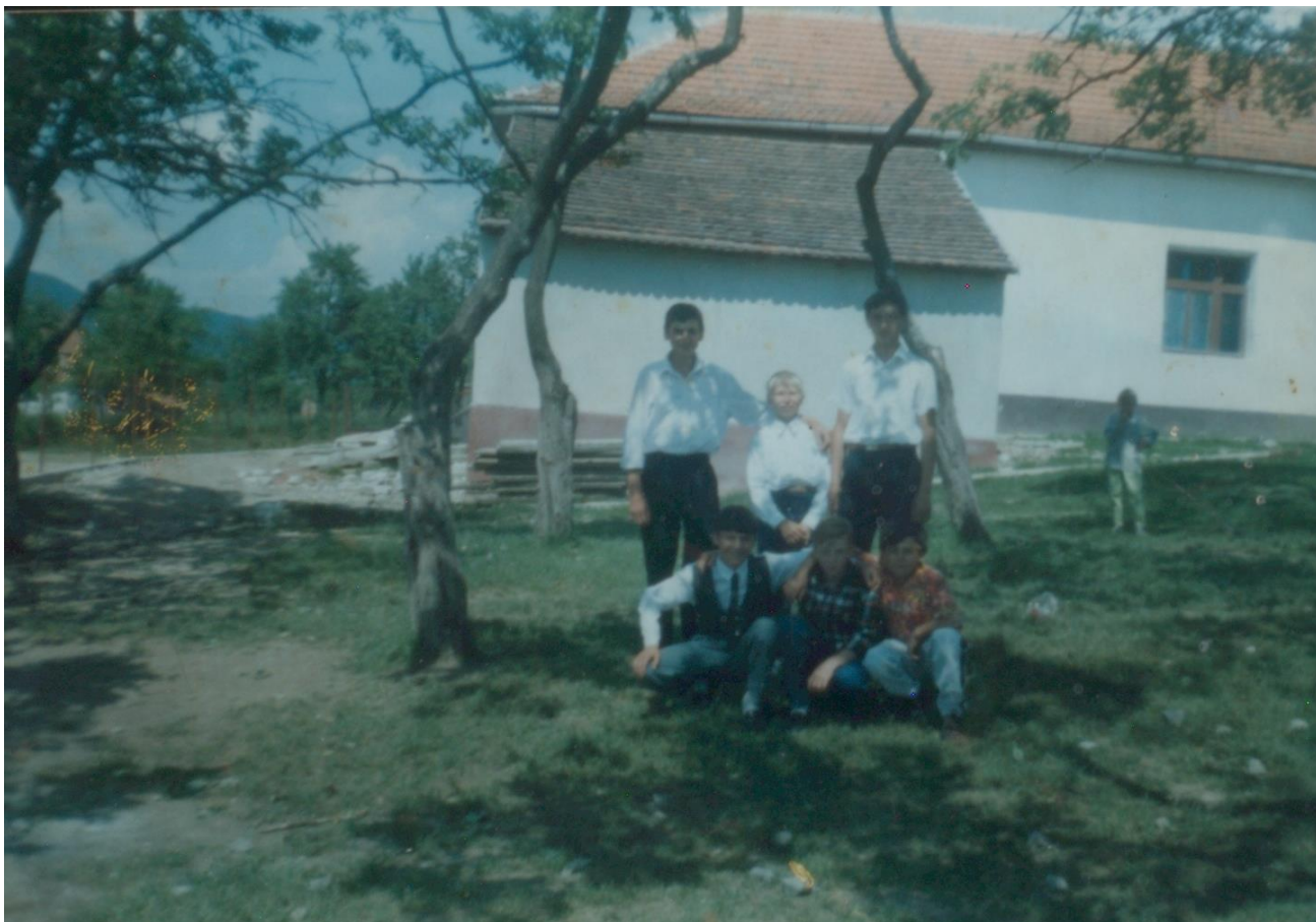
ȘCOALA DIN BOINEȘTI - 1996

Proiect finanțat de Ministerul Culturii și Identității Naționale Beneficiarul proiectului: Județul Satu Mare, Consiliul Județean Implementat și coordonat de Biblioteca Județeană Satu Mare