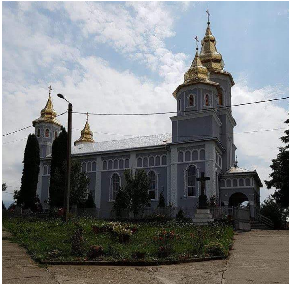
BISERICA ORTODOXĂ - BOINEȘTI - 2017

Proiect finanțat de Ministerul Culturii și Identității Naționale Beneficiarul proiectului: Județul Satu Mare, Consiliul Județean Implementat și coordonat de Biblioteca Județeană Satu Mare