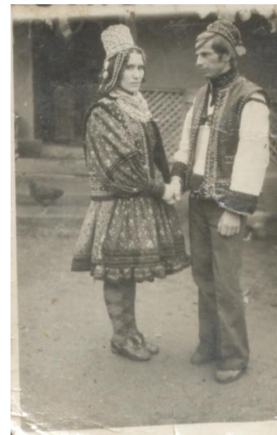
MIRI ÎN BOINEȘTI - 1981

Proiect finanțat de Ministerul Culturii și Identității Naționale Beneficiarul proiectului: Județul Satu Mare, Consiliul Județean Implementat și coordonat de Biblioteca Județeană Satu Mare