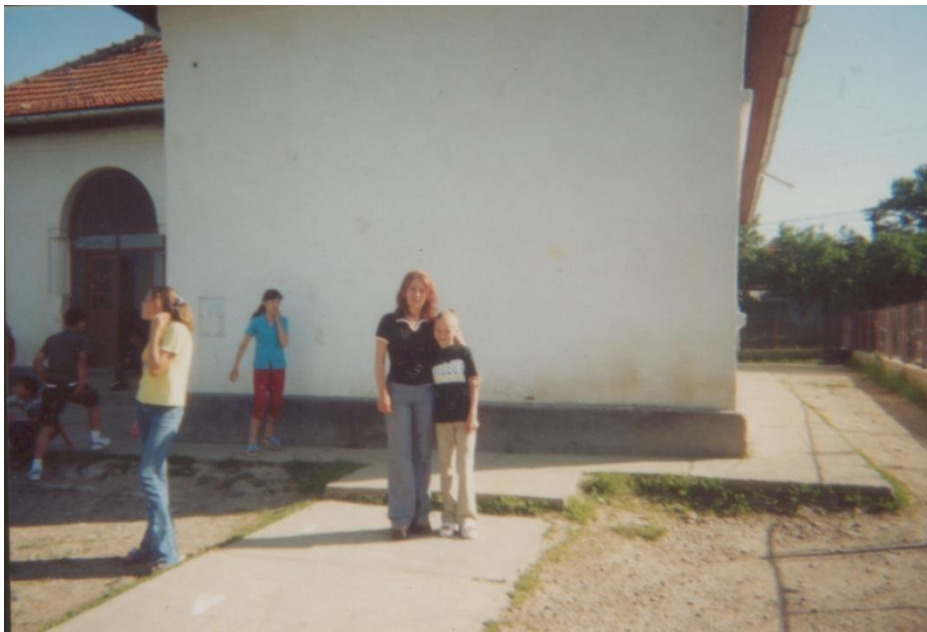
ȘCOALA DIN BOINEȘTI - 2003