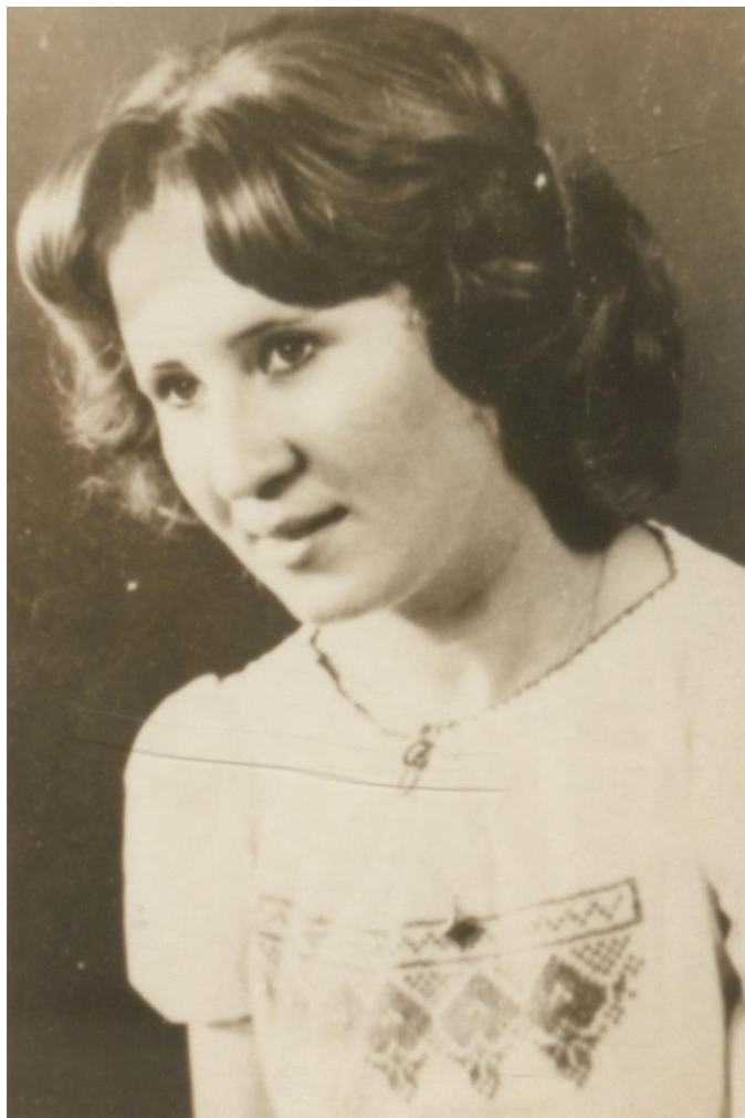
TÂNĂRĂ DIN NEGREȘTI-OAȘ ÎN COSTUM TRADIȚIONAL - 1976

Proiect finanțat de Ministerul Culturii și Identității Naționale Beneficiarul proiectului: Județul Satu Mare, Consiliul Județean Implementat și coordonat de Biblioteca Județeană Satu Mare