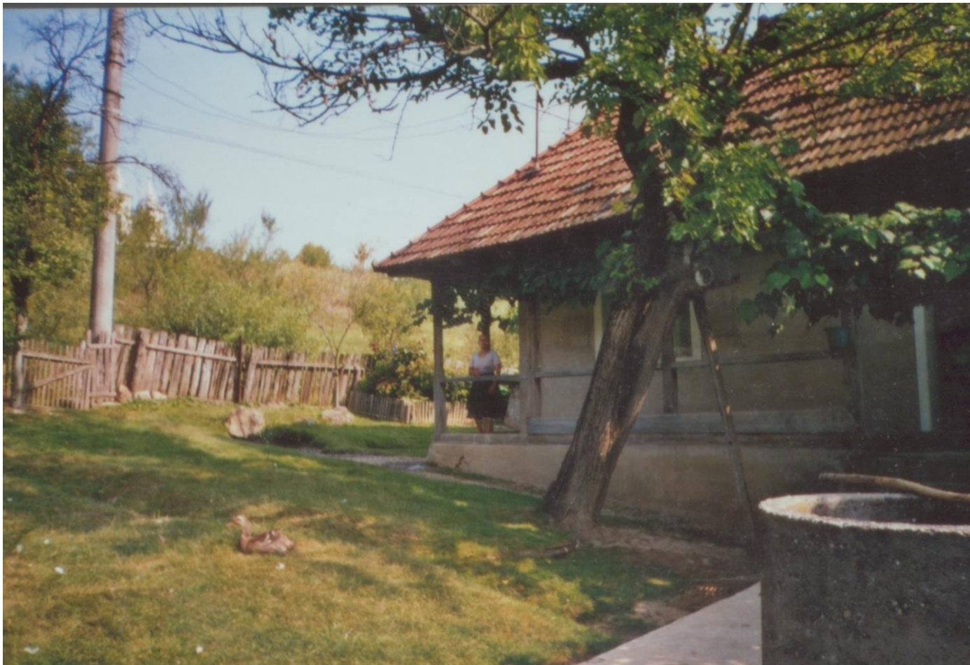
CASĂ CU TÂRNAȚ - BOINEȘTI - 2007

Proiect finanțat de Ministerul Culturii și Identității Naționale Beneficiarul proiectului: Județul Satu Mare, Consiliul Județean Implementat și coordonat de Biblioteca Județeană Satu Mare