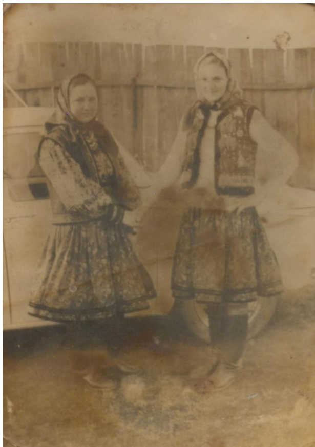
Fete din Bixad în costum traditional, cu somnă și chischineu, 1970