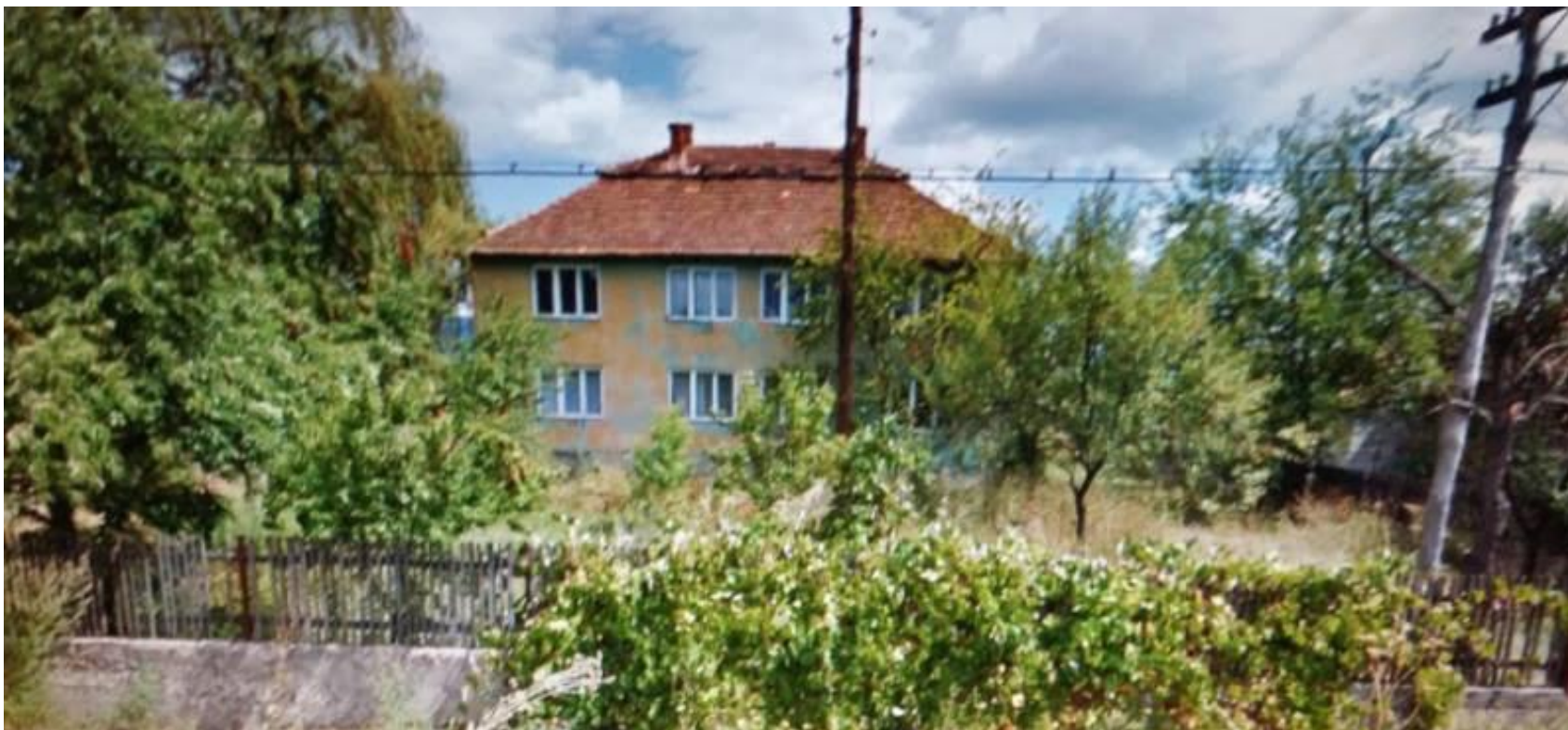
SEDIUL CAP BOINEȘTI - 2015

Proiect finanțat de Ministerul Culturii și Identității Naționale Beneficiarul proiectului: Județul Satu Mare, Consiliul Județean Implementat și coordonat de Biblioteca Județeană Satu Mare