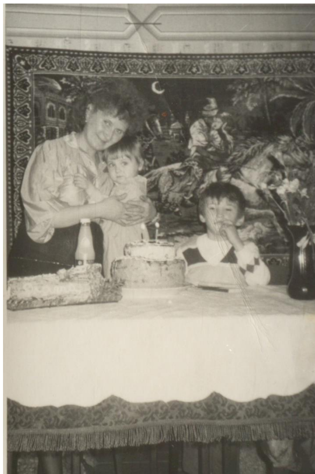
PETRECERE DE ANIVERSARE - 1988

Proiect finanțat de Ministerul Culturii și Identității Naționale Beneficiarul proiectului: Județul Satu Mare, Consiliul Județean Implementat și coordonat de Biblioteca Județeană Satu Mare