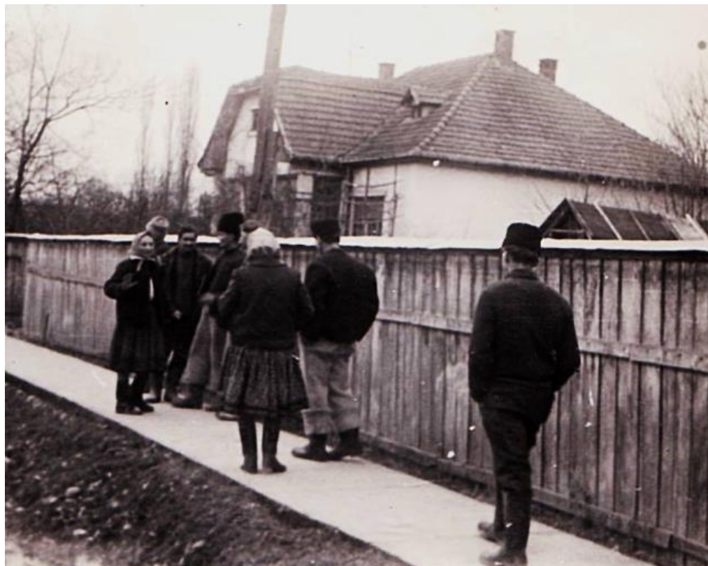
PRIMARIA VECHĂ BIXAD - 1940

Proiect finanțat de Ministerul Culturii și Identității Naționale Beneficiarul proiectului: Județul Satu Mare, Consiliul Județean Implementat și coordonat de Biblioteca Județeană Satu Mare