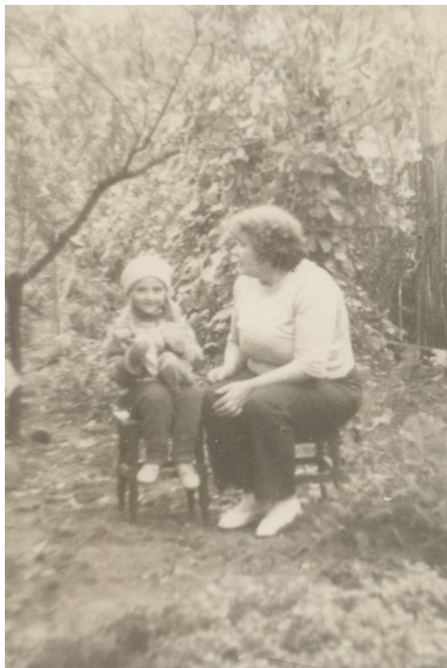
FETIȚĂ DIN NEGREȘTI OAȘ ALĂTURI DE BUNICA EI - 1982

Proiect finanțat de Ministerul Culturii și Identității Naționale Beneficiarul proiectului: Județul Satu Mare, Consiliul Județean Implementat și coordonat de Biblioteca Județeană Satu Mare