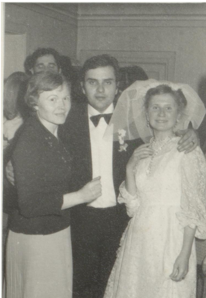
NUNTĂ ÎN OAȘ - 1980