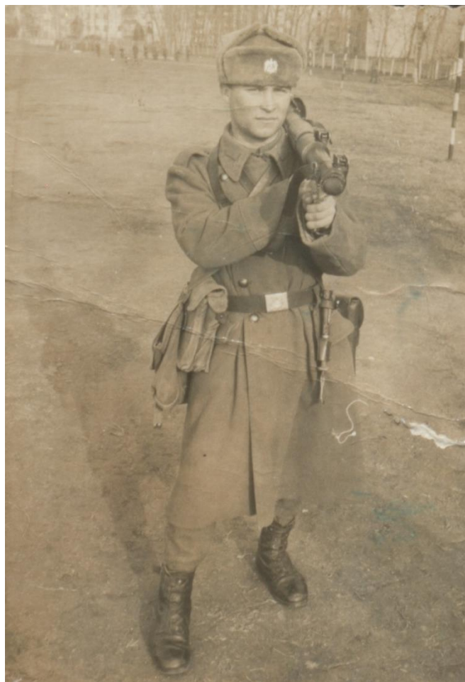
TÂNĂR DIN BOINEȘTI ÎN TIMPUL ARMATEI - 1992

Proiect finanțat de Ministerul Culturii și Identității Naționale Beneficiarul proiectului: Județul Satu Mare, Consiliul Județean Implementat și coordonat de Biblioteca Județeană Satu Mare