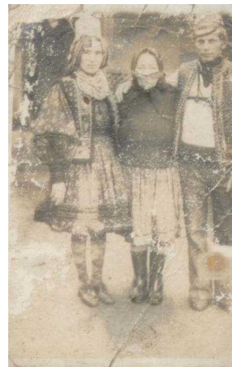
MIRI ÎN COSTUME TRADIȚIONALE - 1981

Proiect finanțat de Ministerul Culturii și Identității Naționale Beneficiarul proiectului: Județul Satu Mare, Consiliul Județean Implementat și coordonat de Biblioteca Județeană Satu Mare