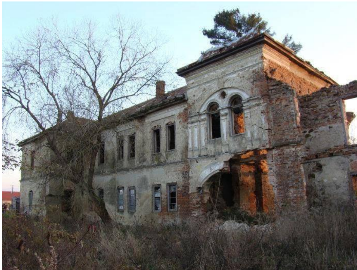
CASTEL PASZTORY, BOINEȘTI - 2014

Proiect finanțat de Ministerul Culturii și Identității Naționale Beneficiarul proiectului: Județul Satu Mare, Consiliul Județean Implementat și coordonat de Biblioteca Județeană Satu Mare