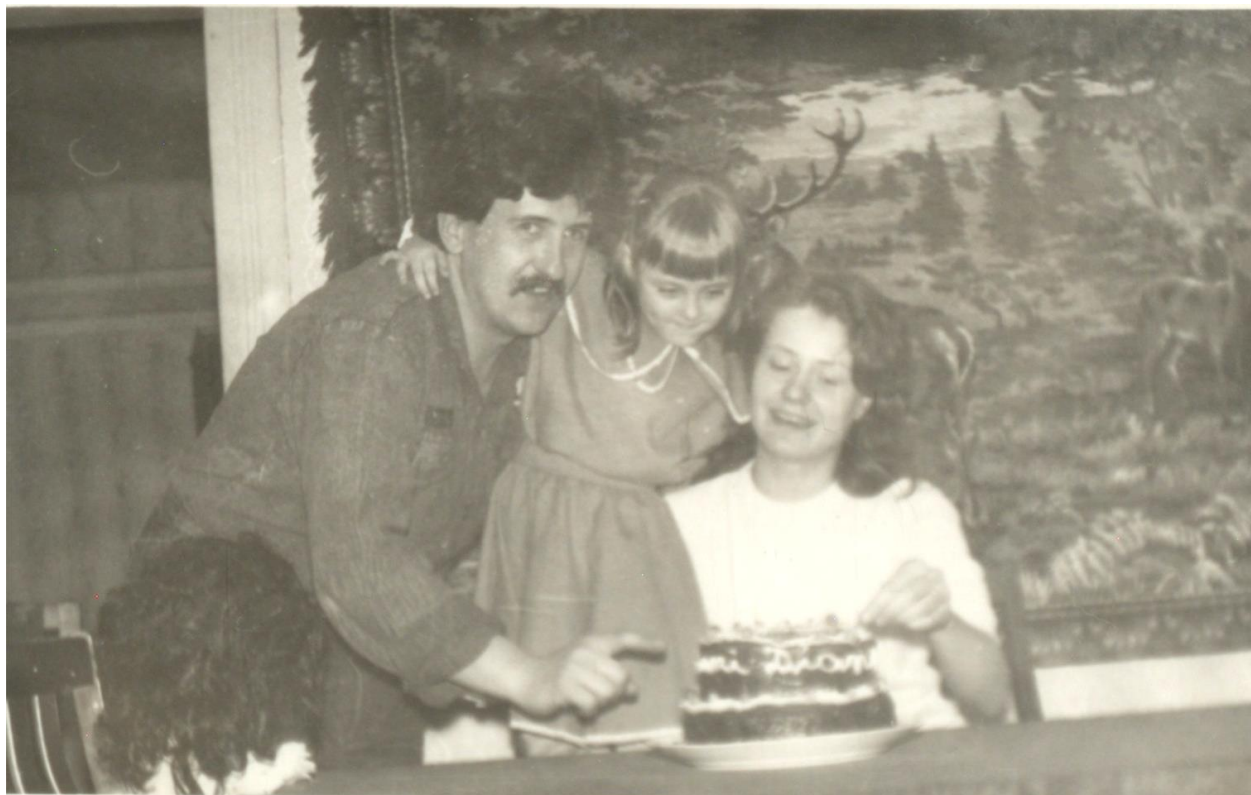
PETRECERE DE ANIVERSARE. ÎN FUNDAL, PERETARUL TRADIȚIONAL - 1992

Proiect finanțat de Ministerul Culturii și Identității Naționale Beneficiarul proiectului: Județul Satu Mare, Consiliul Județean Implementat și coordonat de Biblioteca Județeană Satu Mare