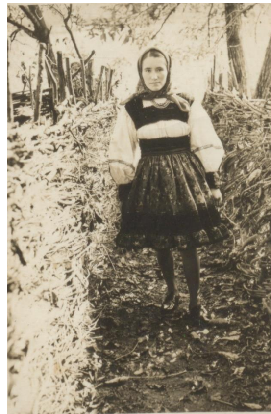
FATĂ ÎN COSTUM TRADIȚIONAL OȘENESC LÂNGĂ UN GARD DE NUIELE BOINEȘTI - 1972

Proiect finanțat de Ministerul Culturii și Identității Naționale Beneficiarul proiectului: Județul Satu Mare, Consiliul Județean Implementat și coordonat de Biblioteca Județeană Satu Mare