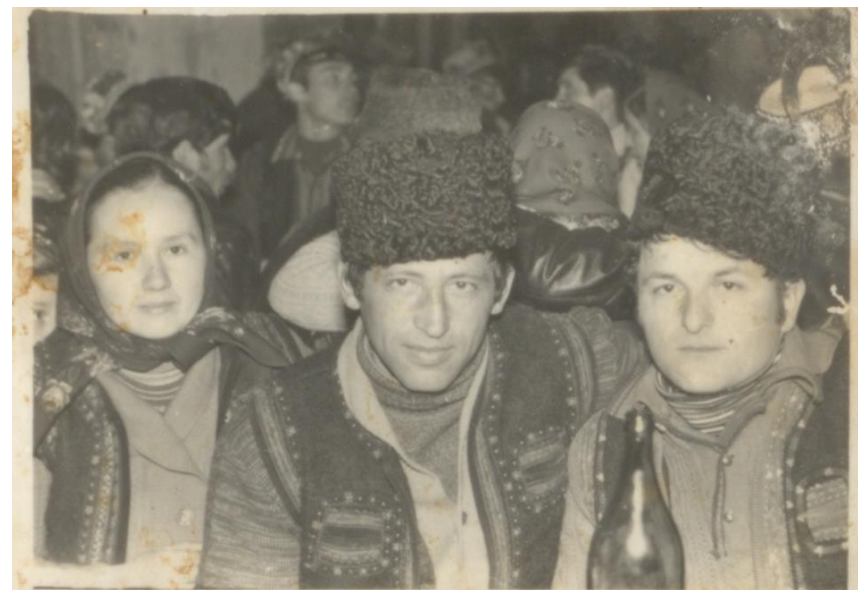
Nuntă în Bixad, 1976

Mirele cu „cunună”, costum traditional de nuntă