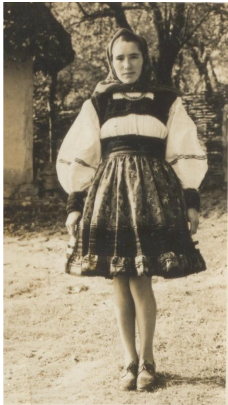
FATĂ ÎN COSTUM TRADIȚIONAL OȘENESC BOINEȘTI - 1977