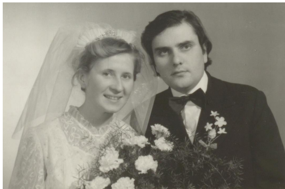
FOTOGRAFIE DE NUNTĂ DIN NEGREȘTI-OAȘ 1984

Proiect finanțat de Ministerul Culturii și Identității Naționale Beneficiarul proiectului: Județul Satu Mare, Consiliul Județean Implementat și coordonat de Biblioteca Județeană Satu Mare