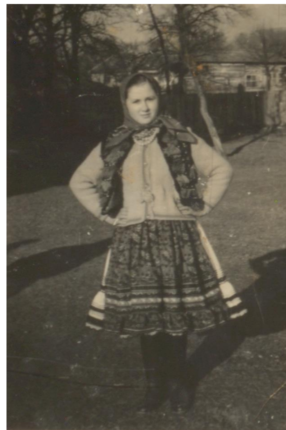
Portul traditional al fetelor din Bixad în anii 1970