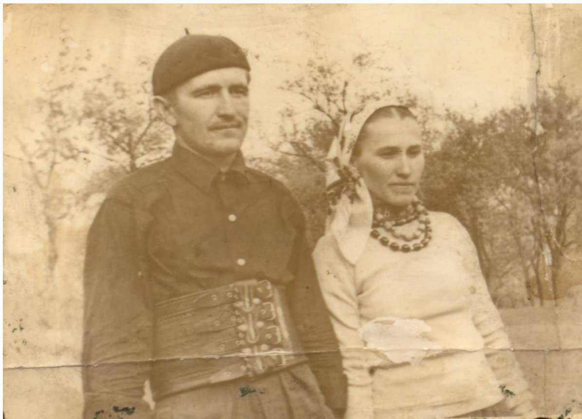
FRAȚI DIN BOINEȘTI - 1965

Proiect finanțat de Ministerul Culturii și Identității Naționale Beneficiarul proiectului: Județul Satu Mare, Consiliul Județean Implementat și coordonat de Biblioteca Județeană Satu Mare